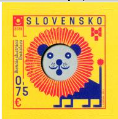
692) Pôvodná kresba V. Rostoku

3. 9. 2019 * Bienále ilustrácií Bratislava 2019 * príležitostná známka * N: V. Rostoka * OF Tiskárna Hradištko * PL: 35 ZP, TF: ? PL * samolepiaci papier BP * vlnitý výsek, ZP na PL oddelené čiarkovým priesečkom 5 * FDC N: BB print * náklad: 350 tis.