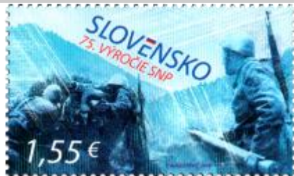
691) Delostrelci povstaleckej armády v boji

28. 8. 2019 * 75. výročie SNP * príležitostná známka * N: P. Augustovič * OF Tiskárna Hradištko * PL: 50 ZP, TF: 2 PL * papier FL * HZ 13 ½ * FDC N: P. Augustovič, OF BB print * náklad: 500 tis.