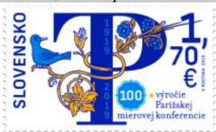
694) Symbolická kresba