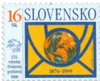
bb) Logo Slovenskej pošty š.p., zemeguľa