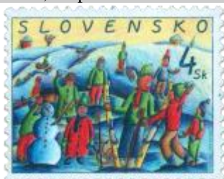
ee) S. Sekereš: Guľovačka

1999, 3. 11. * Vianoce '99 * príležitostná známka realizovaná podľa návrhov detí * N: S. Sekereš (15 rokov), GÚ: M. Činovský, R: A. Feke * OTr+HT PTC * PL: 50 ZP, TF: 2 PL * papier -fls- * RZ 11 1/2 : 11 1/4 * PVSP 99/22/2-268, SM 00/1/13 * FDC N: L. Jaššová, N pečiatky: J. Paškuliaková (13 rokov), GÚ: M. Činovský, R: J. Vitek, OTp PTC