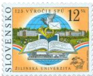
aa) Žilinská univerzita, symboly dopravy, pošty a telekomunikácií