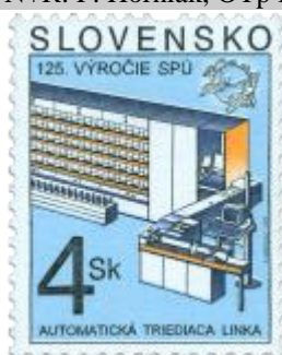
rr) Automatická triediaca linka

1999, 12.3. * 125. výročie SPÚ - automatická triediaca linka * príležitostná známka * N+R: F. Horniak * OTr+HT PTC * PL: 50 ZP, TF: 2 PL * papier -fls- * RZ 11 1/4 : 11 1/2 * PVSP 99/5/2-56, SM 99/5/30 * FDC N+R: F. Horniak, OTp PTC