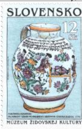
xx) Džbán habánskej keramiky z r. 1776

1999 23. 11. * Múzeum židovskej kultúry na Slovensku * príležitostné známky, slovensko-izraelské vydanie* GÚ+RR: M. Činovský, R: F. Horniak (196), R. Cigánik (197, ozdobná kresba) * OF+OTp PTC * PL: 8 ZP, TF: OF 2 PL, OTp 1 PL pre obidve farby * papier -oz- * RZ 11 3/4 : 11 1/2 * PVSP 99/23/2-283, SM 00/1/14 * FDC GÚ: M. Činovský, R: A. Feke OTp PTC