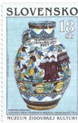
yy) Džbán habánskej keramiky z r. 1734