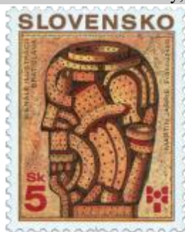
ff) Ilustrácia Martina Jarrieho

1999, 3. 9. * Bienále ilustrácií Bratislava * príležitostná známka * GÚ+RR: M. Činovský, R: F. Horniak * OTr+HT PTC * PL: 50 ZP, TF: 2 PL * papier -fls- * RZ 11 1/4 : 11 1/2 * PVSP 99/17/2-211, SM 99/6/55 * FDC GÚ: M. Činovský, R: A. Feke, OTp PTC