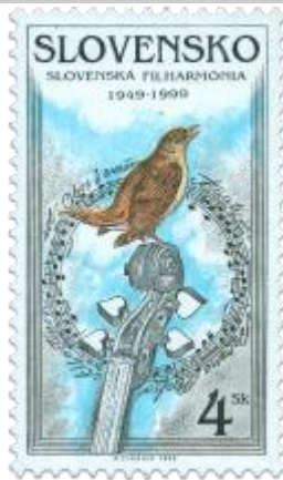
tt) Symbolická kresba

1999, 15. 6. * Slovenská filharmónia * príležitostná známka * N+R. R. Cigánik * OTr+HT PTC * PL: 50 ZP, TF: 2 PL * papier -fls- * RZ 11 1/4 : 11 3/4 * PVSP 99/12/4-136, SM 99/5/31 * FDC N+R. R. Cigánik, OTp PTC