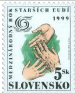
gg) Symbolická kresba rúk troch generácií, logo Medzinárodného roka starších ľudí

1999, 15. 6. * Medzinárodný rok starších ľudí 1999 * príležitostná známka * N: M. Klimčák, R: A. Feke * OTr+HT PTC * PL: 50 ZP, TF: 2 PL * papier -fls- * RZ 11 1/4 : 11 1/2 * PVSP 99/12/4-137, SM 99/5/31 * FDC N: M. Klimčák, R: A. Feke, OTp PTC