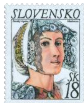
Ženský čepiec z Heľpy