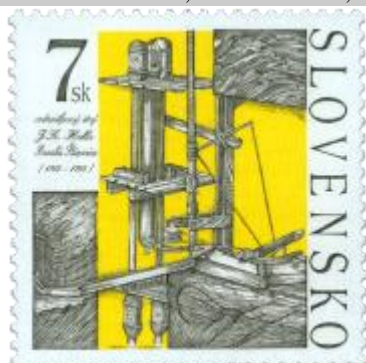
ff) Vodnostlpcový stroj

1999, 21. 9. * Vodnostlpcový stroj J. K. Hella (Technické pamiatky) * príležitostná známka * N: I. Benca, R: F. Horniak * OTr+HT PTC * PL: 35 ZP, TF: 2 PL * papier -fls- * RZ 11 1/4 * PVSP 99/19/2-238, SM 99/6/55 * FDC N: I. Benca, R: F. Horniak, OTr PTC