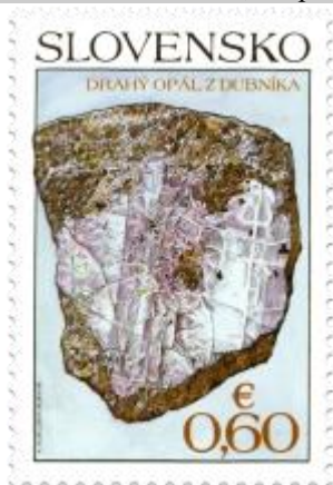
548) Drahý opál z Dubníka

2013, 11. 10. * Slovenské minerály (Ochrana prírody) * príležitostné známky * N: K. Felix, R: F. Horniak * OTp+OF PTC, Praha * PL: 3 ZP + 3 ZP, TF: OF 1 PL, OTp 1 PL * papier FLA * RZ 11 ¾ : 11 ½ * FDC N: K. Felix, R: F. Horniak, OTp TAB * náklady: po 180 tis. (60 tis. PL)