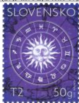
541) Dvanásť znamení zvieratníka

2013, 7. 6. * Zvieratník - známka s personalizovaným kupónom * príležitostná známka určená na personalizáciu kupónu * N: A. Ferda * OF PTC * PL: 8 ZP + 8 K, TF: 8 PL (5 s kupónmi „HC Slovan Bratislava“ + 3 s nepotlačenými kupónmi) * papier FLA * HZ 11 ¼ : 11 ¾ * FDC N: A. Ferda, OF Kasico * náklad: 220 tis. (27,5 tis. PL, z toho 17,5 tis. PL s kupónom „HC Slovan Bratislava“ a 10 tis. PL s nepotlačeným kupónom)