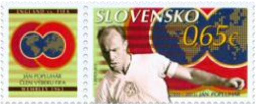
533) Ján Popluhár (1935 – 2011) – slovenský futbalista

2013, 14. 2. * Ján Popluhár * príležitostná známka * N: I. Benca * OF PTC * PLa: 50 ZP, TF: 4 PLa, PLb: 8 ZP + 8 K, TF: 4 PLb * papier FLA * KHZ 11 ¾ : 11 ¼ * FDC N: I. Benca, OF TAB * náklad: 1,128 mil. (20 tis. PLa, 16 tis. PLb)