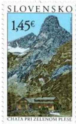
547) Chata pri Zelenom plese