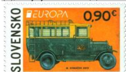
538) Poštový autobus Škoda 125 z roku 1928

2013, 9. 5. * Poštové vozidlo (Europa) * príležitostná známka * N: M. Komáček * OF PTC * PL: 50 ZP (A), TF: 1 PL; ZZ: 6 ZP (B), TF: 3 ZZ * papier FL s matným lepom (A), samolepiaci FLA (B) * KHZ 11 ¾ : 11 ¼ (A), vlnitý výsek 16 ¼ : 15 (B) * FDC N: M. Komáček, OF Kasico * náklad: 300 tis. (A), 90 tis. (B, 15 tis. ZZ)