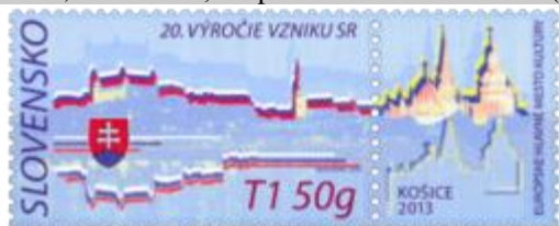
531) Panoráma Bratislavy, štátny znak SR

2013, 1. 1. * 20. výročie vzniku SR, Košice – európske hlavné mesto kultúry 2013 * príležitostná známka * N: P. Augustovič * OF PTC * PL: 8 ZP + 8 K, TF: 4 PL * papier FLA * KHZ 11 ¾ : 11 ¼ * FDC N: P. Augustovič, R: J. Česla, OTp PTC * náklad: 200 tis. (25 tis. PL)