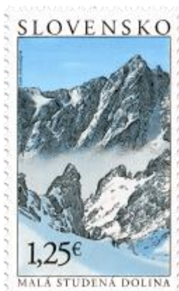
546) Malá studená dolina