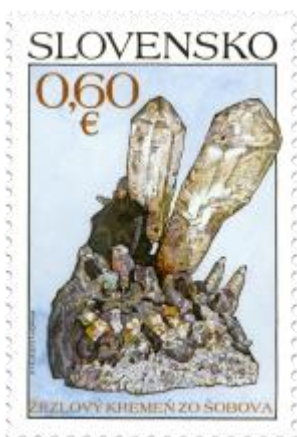
549) Žezlový kremeň zo Šobova