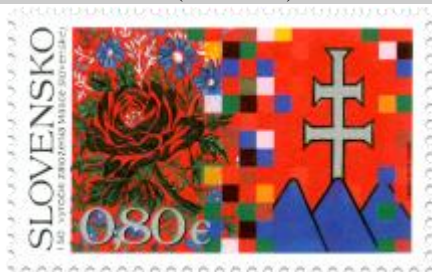
544) symbolická kresba

2013, 2. 8. * 150. výročie založenia Matice slovenskej * príležitostná známka * N: I. Benca, R: R. Cigánik * OTp+OF PTC * PL: 8 ZP + 1 K, TF: 1 PL * papier FL * RZ 11 ¾ FDC N: I. Benca, R: R. Cigánik, OTp TAB * náklad: 200 tis. (25 tis. PL)