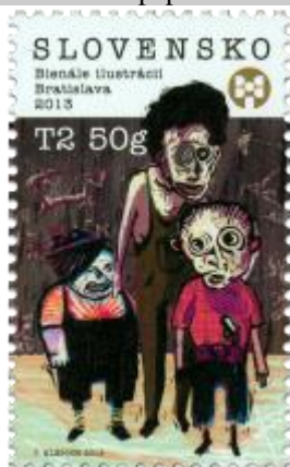
545) Ilustrácia Tomáša Klepocha z knihy „Ako som sa stal mudrcom“

2013, 2. 9. * Bienále ilustrácií Bratislava 2013 * príležitostná známka * N: T. Klepoch * OF PTC * PL: 50 ZP, TF: 4 PL * papier FLA * KHZ 11 ¼: 11 ¾ * FDC N: T. Klepoch, OF Kasico * náklad: 300 tis.