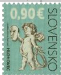
532) Dieťaťko „putti“ so symbolmi divadelného umenia

2013, 25. 1. * Kultúrne dedičstvo Slovenska: Empírové divadlo v Hlohovci * výplatná známka * N: I. Piačka, R: M. Činovský * OTr+HT PTC * PL: 100 ZP, TF: 2 PL * papier FLA * RZ 11 ¾ : 11 ¼ * FDC N: I. Piačka, R: L. Žálec, OTp TAB * náklad: 2 mil.