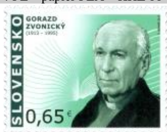
543) Gorazd Zvonický (1913 – 1995) – slovenský básnik, katolícky kňaz a exilový pracovník

2013, 28. 6. * Gorazd Zvonický (Osobnosti) * príležitostná známka * N: P. Uchnár * OF PTC * PL: 50 ZP, TF: 4 PL * papier FLA * KHZ 11 ¾ : 11 ¼ * FDC N: P. Uchnár, OF Kasico * náklad: 1 mil.