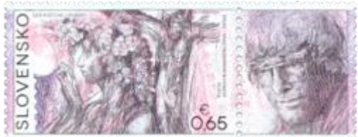
554) alegorická kresba

kupón) Igor Rumanský (1946 – 2006) – slovenský maliar, grafik, ilustrátor a výtvarný pedagóg