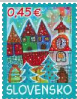
550) víťazná vianočná detská kresba

2013, 4. 11. * Vianočná pošta 2013 * príležitostná známka * N: E. Korkováňová, GÚ: A. Ferda * OF PTC * PL: 8 ZP + 8 K, TF: 8 PL (A) (6 s kupónmi „RND“ + 2 s nepotlačenými kupónmi); ZZ: 10 ZP, TF: 6 ZZ (B) * papier FLA (A), samolepiaci FLA (B) * HZ 11 ¼ : 11 ¾ (A), vlnitý výsek 15 : 16 ½ (B) * FDC N: M. Ivaničová, OF Kasico * náklad: 168 tis. (A), 540 tis. (B, 54 tis. ZZ)