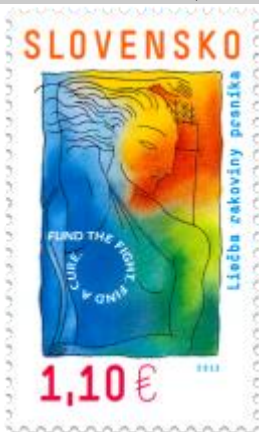
536) Symbolická kresba

2013, 12. 4. * Liečba rakoviny prsníka * príležitostná známka * N: W. Shermanová, GÚ: V. Rostoka * OF PTC * PL: 50 ZP, TF: 4 PL * papier FLA * KHZ 11 ¼ : 11 ¾ * FDC N: V. Rostoka, OF Kasico * náklad: 2 mil.