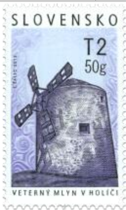
537) Veterný mlyn v Holiči (19. stor.)

2013, 26. 4. * Veterný mlyn v Holiči (Technické pamiatky) * príležitostná známka * N+R: Ľ. Žálec * OTr+HT PTC * PL: 50 ZP, TF: 2 PL * papier FLA * RZ 11 ¼ : 11 ¾ * FDC N: Ľ. Žálec, OF Kasico * náklad: 1 mil.