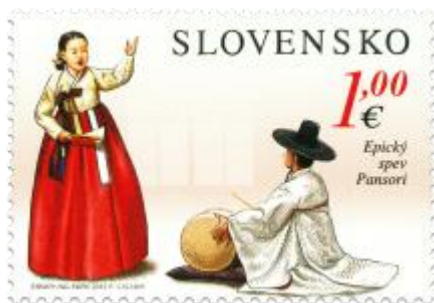
540) Epický spev Pansori – speváčka s bubenikom