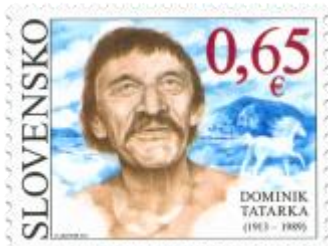
535) Dominik Tatarka (1913 – 1989) – slovenský spisovateľ