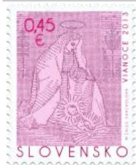
551) Ľudové motívy v diele Ľudovíta Fullu (1902-1980)