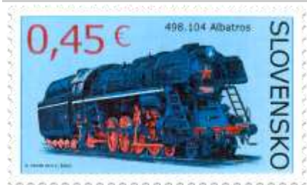
586) Parná lokomotíva 498.104 „Albatros“ z r. 1954

2015, 17. 4. * Parné lokomotívy (Technické pamiatky) * príležitostné známky * N: R. Makar (586), M. Komáček (587), R: Ľ. Žálec (586), R. Cigánik (587) * OTr+HT PTC * PL: 50 ZP, TF: 2 PL * papier FLA * RZ 11 ¾ : 11 ¼ * FDC N: R. Makar (586), M. Komáček (587), R: Ľ. Žálec (586), R. Cigánik (587), OTr PTC * náklad: po 1 mil.