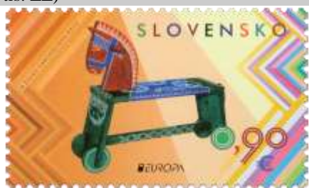
588) Drevený stolček – „koník – bežka“

2015, 5. 5. * Staré hračky (Europa) * príležitostná známka * N: M. Žálec Varcholová * OF PTC * PL: 8 ZP (A), TF: 16 PL; ZZ: 6 ZP (B), TF: 3 ZZ * papier FLA (A), samolepiaci FLA (B) * KHZ 11 ¾ : 11 ¼ (A), vlnitý výsek 16 ¼ : 15 (B) * FDC N: M. Žálec Varcholová, OF Kasico * náklad: A - 200 tis. (25 tis. PL), B - 90 tis. (15 tis. ZZ)