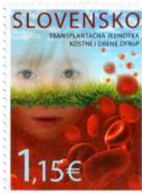
584) Symbolická kresba

2015, 16. 3. * Transplantačná jednotka kostnej drene DFNsP * príležitostná známka * N: I. Benca * OF PTC * PL: 50 ZP, TF: 2 PL * papier FL * HZ 12 * FDC N: I. Benca, OF Kasico * náklad: 2 mil.