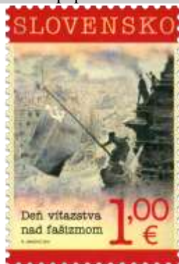
589) Vztýčenie zástavy ZSSR nad Berlínom

2015, 8. 5. * Deň víťazstva nad fašizmom * príležitostná známka * N: R. Jančovič * OF PTC * PL: 50 ZP, TF: 4 PL * papier FLA * KHZ 11 ¼ : 11 ¾ * FDC N: R. Jančovič, R: R. Cigánik, OTr PTC * náklad: 300 tis.