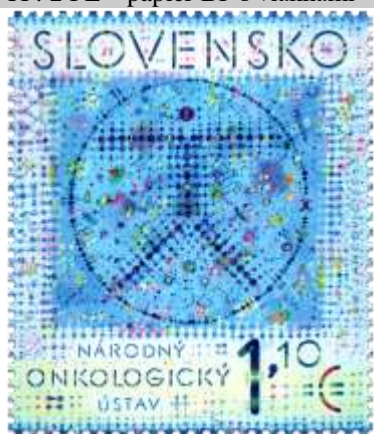
598) Motív človeka v kruhu od Leonarda Da Vinciho

2015, 5. 11. * Národný onkologický ústav * príležitostná známka * N: R. Jančovič * OF Kasico * PL: 25 ZP, TF: 2 PL * papier BP s vláknami * HZ 12 ½ : 12 ¾ * FDC N: R. Jančovič, OF Kasico * náklad: 2 mil.