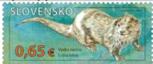
595) Vydrá riečna ( Lutra lutra )

2015, 9. 10. * Chránená krajinná oblasť Poľana (Ochrana prírody) * príležitostné známky v hárčekovej úprave * N: I. Piačka (595), J. Piačková (596), R: Ľ. Žálec * OTp+OF PTC, Praha * H: 2 ZP + 5 K, TF: OF 1 H, OTp 1 H * papier FLA * RZ 11 ¾ * FDC N: I. Piačka, R: Ľ. Žálec, OTp PTC * náklady: po 50 tis.