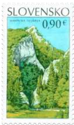
594) Manínska tiesňava