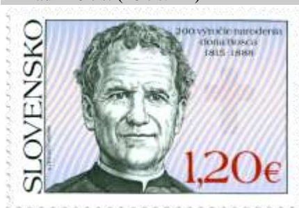
591) Giovanni Melchior Bosco (1815 – 1888) – zakladateľ rehoľnej spoločnosti „saleziánov“