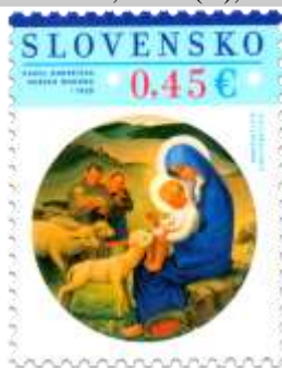
599) Karol Ondreička (1898 – 1961): Horská Madona (1939)

2015, 13. 11. * Vianoce 2015: Vianočné motívy v diele Karola Ondreičku (1898 – 1961) * príležitostná známka * N: V. Rostoka * OF PTC * PL: 50 ZP, TF: 4 PL (A); ZZ: 10 ZP (B), TF: 6 ZZ * papier FLA (A), samolepiaci FLA (B) * KHZ 11 ¼ : 11 ¾ (A), vlnitý výsek 16 ½ : 15 (B) * FDC N: V. Rostoka, OF Kasico * náklad: 1,7 mil. (A), 300 tis. (B, 30 tis. ZZ)