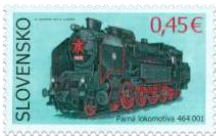
587) Parná lokomotíva 464.001 „Ušatá“ z r. 1933