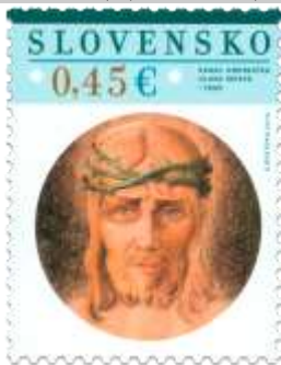
583) Karol Ondreička (1898 – 1961): Hlava Krista (1940)

2015, 6. 3. * Veľká noc 2015: Veľkonočné motívy v diele Karola Ondreičku (1898 – 1961) * príležitostná známka * N: V. Rostoka * OF PTC * PL: 50 ZP (A), TF: 4 PL; ZZ: 10 ZP (B), TF: 6 ZZ * papier FL (A), samolepiaci FL (B) * KHZ 11 ¼ : 11 ¾ (A), vlnitý výsek 16 ½ : 15 (B) * FDC N: V. Rostoka, OF Kasico * náklad: 1,7 mil. (A), 300 tis. (B, 30 tis. ZZ)