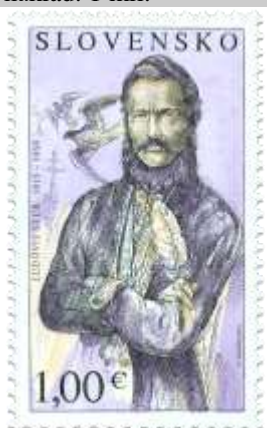
597) Ľudovít Štúr (1815-1856) – jazykovedec, politik a novinár