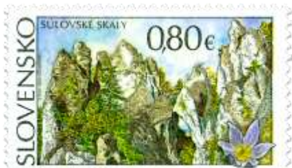
593) Súľovské skaly