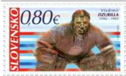
585) Vladimír Dzurilla (1942 – 1995) – slovenský hokejový brankár

2015, 31. 3. * Vladimír Dzurilla * príležitostná známka, rady známok v protichodnom usporiadaní * N: I. Benca * OF PTC * PL: 30 ZP + 30 K, TF: 4 PL * papier FL * KHZ 11 ¾ : 11 ¼ * FDC N: I. Benca, OF Kasico * náklad: 210 tis.