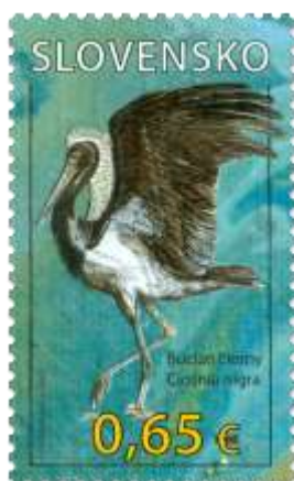
596) Bocian čierny ( Ciconia nigra )

kupón A: názov CHKO a letiace bociany, kupón B: logotypy, kupón C: letiaci bocian, kupón D: vydry, kupón E: rosnička, salamandra a pstruh