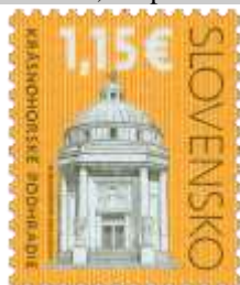
580) Mauzóleum Andrášiovcov (20. stor.)

2015, 2. 1. * Kultúrne dedičstvo Slovenska: Krásnohorské Podhradie * výplatná známka * N: P. Augustovič R: J. Česla * OTr+HT PTC * PL: 100 ZP, TF: 2 PL * papier FLA * RZ 11 ¾ : 11 ¼ * FDC N: P. Augustovič R: J. Česla, OTp PTC * náklad: 2 mil.