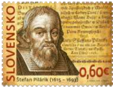
582) Štefan Pilárik (1615 – 1693) – slovenský básnik