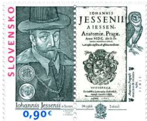
613) Ján Jessenius (1566–1621) – lekár a vedec