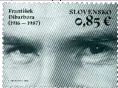
626) František Dibarbora (1916 – 1987) – slovenský herec

2016, 18. 11. * František Dibarbora (Osobnosti) * príležitostná známka * N: Ľ. Segečová * OF PTC * PL: 50 ZP, TF: 2 PL * papier FL * KHZ 12 * FDC N: Ľ. Segečová, OF Kasico * náklad: 1 mil.