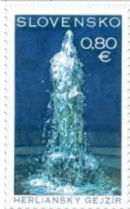
618) Herlianský gejzír

2016, 19. 9. * Herlianský gejzír (Krásy našej vlasti) * príležitostná známka * N+R: M. Činovský * OTp+OF PTC * PL: 10 ZP, TF: 1 PL * papier FLA * RZ 11 ¾ * FDC N+R: M. Činovský, OTp PTC * náklad: 90 tis. (9 tis. PL).