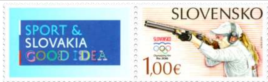
615) športová strel'ba, logo

2016, 8. 7. * XXXI. letné OH Rio de Janeiro * príležitostná známka * N: K. Felix, N kupónu: A. Ferda * OF PTC * PL: 30 ZP + 20 K, TF: 4 PL * papier FL * KHZ 11 ¼ : 11 ¼ * FDC N: K. Felix, RR: J. Česla, OF Kasico * náklad: 210 tis.