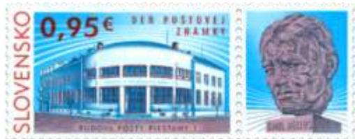
627) budova pošty Piešťany 1

2016, 2. 12. * Budova pošty Piešťany 1 (Deň poštovej známky) * príležitostná známka * N+R: J. Česla * OTr+HT PTC * PL: 30 ZP + 30 K, TF: 2 PL * papier FLA * RZ 11 ¾ : 11 ¾ * FDC N+R: J. Česla, OTp PTC * náklad: 1,05 mil.