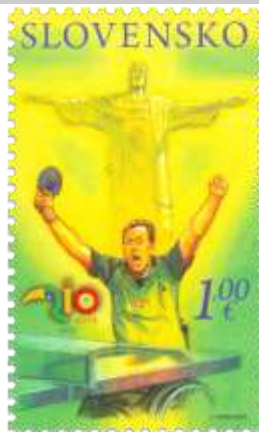
616) stolný tenis, socha Krista v Riu de Janeiro, logo paralympiády

2016, 8. 7. * XV. letné paralympijské hry Rio de Janeiro * príležitostná známka * N: I. Piačka * OF PTC * PL: 50 ZP, TF: 4 PL * papier FL * KHZ 11 ¼ : 11 ¼ * FDC N: I. Piačka, R: J. Česla, Otp PTC * náklad: 200 tis.