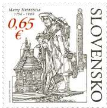
608) Matej Hrebenda (1796 – 1880) – slovenský národný buditeľ