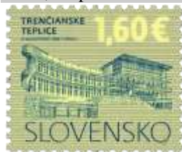
606) Kúpalisko „Zelená žaba“ v Trenčianskych Tepliciach

2016, 10. 2. * Kultúrne dedičstvo Slovenska: Trenčianske Teplice * výplatná známka * N: P. Augustovič, R: L. Žálec * OTr+HT PTC * PL: 100 ZP, TF: 2 PL * papier FLA * RZ 11 ¼ : 11 ¾ * FDC N: P. Augustovič, R: L. Žálec, OTp PTC * náklad: 2 mil.