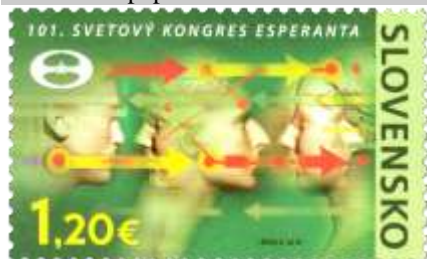
617) symbolická kresba komunikácie

2016, 23. 7. * 101. svetový kongres Esperanta * príležitostná známka * N: I. Benca * OF PTC * PL: 50 ZP, TF: 4 PL * papier FL * KHZ 11 ¾ : 11 ¼ * FDC N: I. Benca, OF Kasico * náklad: 300 tis.