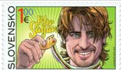
610) Peter Sagan (nar. 1990) – majster sveta v cestnej cyklistike 2015

2016, 21. 4. * Majstrovstvá sveta v cestnej cyklistike 2015 – Peter Sagan * príležitostná známka * N: J. Gertli Danglár * OF PTC * PL: 50 ZP, TF: 2 PL * papier FL * KHZ 11 ¾ : 11 ¼ * FDC N: J. Gertli Danglár, OF Kasico * náklad: 300 tis.