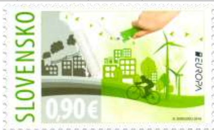
611) Symbolická kresba

2016, 5. 5. * Ekológia v Európe – myslí zeleno! (Europa) * príležitostná známka * N: D. Sergidou, GÚ: A. Ferda * OF PTC * PL: 8 ZP (A), TF: 8 PL; ZZ: 6 ZP (B), TF: 3 ZZ * papier FL (A), samolepiaci FL (B) * KHZ 11 ¾ : 11 ¼ (A), vlnitý výsek 16 ¼ : 15 (B) * FDC N: A. Ferda, OF Kasico * náklad: A - 200 tis. (25 tis. PL), B - 90 tis. (15 tis. ZZ)