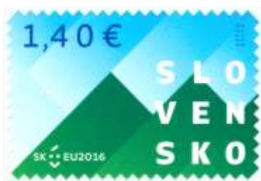
614) Symbolická kresba, logo