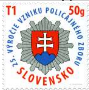
604) Logo PZ SR

2016, 25. 1. * 25. výročie vzniku Policajného zboru SR * príležitostná známka * N: A. Ferda * OF PTC * PL: 50 ZP, TF: 2 PL * papier FL * KHZ 12 * FDC N: A. Ferda, OF Kasico * náklad: 300 tis.