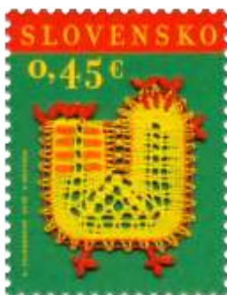
607) A. Folkmerová: „Veľkonočné kuriatko“, paličkovaná čipka