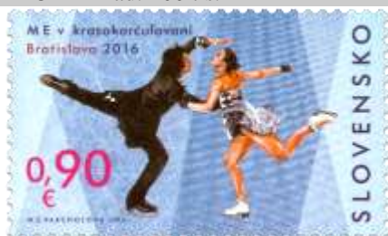
605) Pár krasokorčuľiarov

2016, 27. 1. * ME v krasokorčuľovaní v Bratislave * príležitostná známka * N: M. Žálec Varcholová * OF PTC * PL: 50 ZP, TF: 4 PL * papier FL * KHZ 11 ¾ : 11 ¼ * FDC N: M. Žálec Varcholová, R: Ľ. Žálec, OTp PTC * náklad: 200 tis.