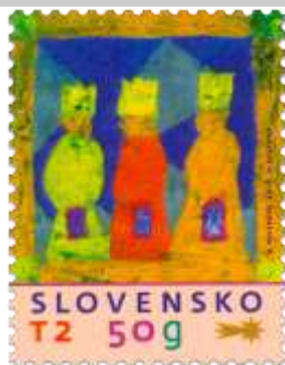
624) Traja králi

2016, 11. 11. * Vianočná pošta 2016 * príležitostná známka * N: V. Peceková, GÚ: V. Rostoka * OF PTC * PL: 50 ZP, TF: 4 PL * papier FL * KHZ 11 ¼ : 11 ¾ * FDC N: V. Berkyová, NP: Š. Števula, GÚ: V. Rostoka, OF Kasico * náklad: 1 mil.