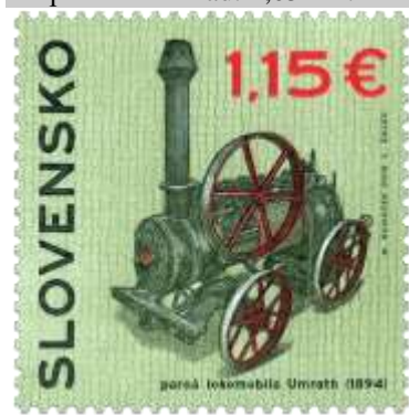
609) Parná lokomobila Umrath z r. 1894

2016, 15. 4. * Parná lokomobila Umrath (Technické pamiatky) * príležitostná známka * N: M. Komáček, R: L. Žálec * OTr+HT PTC * PL: 35 ZP, TF: 2 PL * papier FLA * RZ 11 ¼ * FDC N: M. Komáček, R: L. Žálec, OTr PTC * náklad: 1,05 mil.