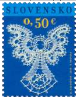
625) M. Habardová: „Anjel“, paličkovaná čipka

2016, 14. 11. * Vianoce 2016: Paličkovaná čipka * príležitostná známka * N: M. Habardová, GÚ: V. Rostoka * OF PTC * PL: 50 ZP, TF: 4 PL (A); ZZ: 10 ZP (B), TF: 6 ZZ * papier FL (A), samolepiaci FL (B) * KHZ 11 ¼ : 11 ¾ (A), pílkovitý výsek 16 ½ : 15 (B) * FDC N: V. Jursová, NP: I. Žlnková, GÚ: V. Rostoka, OF Kasico * náklad: 1,7 mil. (A), 300 tis. (B, 30 tis. ZZ)