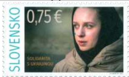
774) fotografia utečenkyne

16. 9. 2022 * Solidarita s Ukrajinou * príležitostná známka * N: P. Konečný * OF Tiskárna Hradištko * PL: 50 ZP, TF: 2 PL * papier FL * KHZ 11¼ : 11¼ * FDC N: M. Kovalenko, OF Tiskárna Hradištko * náklad: 500 tis.