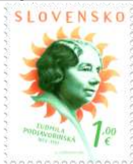
763) Ludmila Podjavorinská (1872 – 1951) – slovenská prozaička a poetka

8. 4. 2022 * Osobnosti: Ľudmila Podjavorinská (1872 – 1951) * príležitostná známka * N: N. Ložeková * OF Tiskárna Hradištko * PL: 50 ZP, TF: 2 PL * papier FL * HZ 11¼ : 11¾ * FDC N: N. Ložeková, R: J. Česla, OTp Tiskárna Hradištko * náklad: 1 mil.