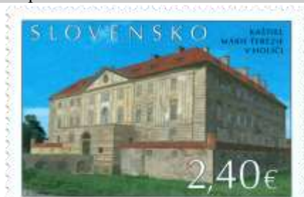
767) Kaštieľ Márie Terézie v Holíči (prestavaný v 18. stor.)

10. 6. 2022 * Krásky našej vlasti: Kaštieľ Márie Terézie v Holíči * príležitostná známka * N+R: M. Činovský * OTp+OF Tiskárna Hradištiko * PL: 6 ZP, TF: 1 PL * papier FL * RZ 11½ : 11¾ * FDC N+R: M. Činovský, OTp Tiskárna Hradištiko * náklad: 60 tis. (10 tis. PL)