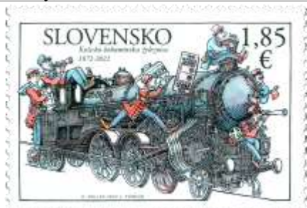
761 a dolný kupón) parné rušne používané na Košicko-bohumínskej železnici s postavičkami železničných profesií a cestujúcich horný kupón) parný rušeň používaný na ozubnicovej železnici Štrba-Štrbské Pleso háčček) mapa rakúsko-uhorských železníc, historické logotypy železníc

18. 3. 2022 * Spoločné vydanie s Českou republikou: 150. výročie uvedenia do prevádzky Košicko-bohumínskej železnice * príležitostná známka v háččkovvej úprave, spoločné vydanie s ČR * N: D. Kállay, R: J. Tvrdoň * OTp+OF Tiskárna Hradištko * H: 1 ZP + 2 K, TF: 1 H * papier FL * RZ 11½ : 11¾ * FDC N: D. Kállay, OF Tiskárna Hradištko * náklad: 49 tis.