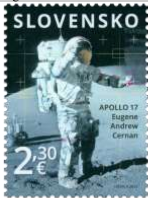
782) Astronaut E. A. Cernan (1934 – 2017) na povrchu Mesiaca

24. 11. 2022 * 50. výročie pristátia misie Apollo 17 na Mesiaci: Eugen Andrew Cernan * príležitostná známka * N: I. Benca * OF Tiskárna Hradištiko * PL: 50 ZP, TF: 2 PL * papier FL * HZ 12 * FDC N: I. Benca, digitálna tlač Tiskárna Hradištiko * náklad: 250 tis.