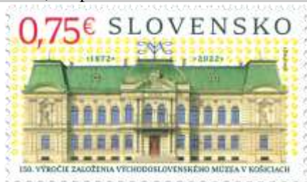
779) budova Východoslovenského múzea v Košiciach

* N: J. Česla * OF Tiskárna Hradištko * PL: 50 ZP, TF: 2 PL * papier FL * KHZ 11¾ : 11¾ * FDC N+R: J. Česla, OTp Tiskárna Hradištko * náklad: 500 tis.