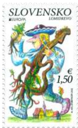
765) Rozprávková postava Lomidrevo