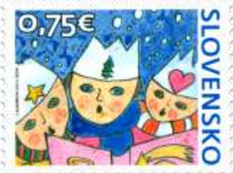
780) detská kresba troch koledníkov

11. 11. 2022 * Vianočná pošta 2022 * príležitostná známka * N: V. Bubeníková, GÚ: A. Ferda * OF Tiskárna Hradištiko * PL: 50 ZP, TF: 2 PL * papier FL * HZ 11¼ : 11¼ * FDC N: K. Gubienová, NP: N. A. Samai, GÚ: A. Ferda, digitálna tlač Tiskárna Hradištiko * náklad: 1 mil.