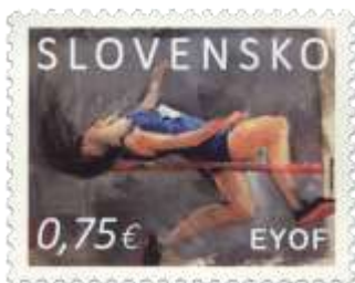
770) skokanka do výšky