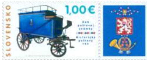
783) voz čs. pošty používaný na doručovanie balíkov

2. 12. 2022 * Deň poštovej známky: Historický poštový voz * príležitostná známka * N: M. Žálec Varcholová * OF Tiskárna Hradištiko * PL: 30 ZP + 30 K, TF: 2 PL * papier FL * HZ 11¼ : 11¼ * FDC N: M. Žálec Varcholová, R: L. Žálec, OTp Tiskárna Hradištiko * náklad: 300 tis.