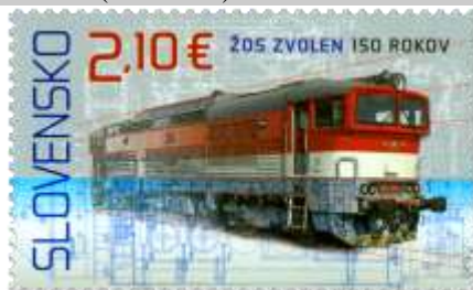
768) Deselektický motorový rušeň radu 757

22. 6. 2022 * 150. výročie vzniku ŽOS Zvolen * príležitostná známka * N: J. Česla * OF Tiskárna Hradištiko * PL: 8 ZP + 1 K, TF: 6 PL * papier FL * RZ 13½ : 14 * FDC N+R: J. Česla, OTp Tiskárna Hradištiko * náklad: 120 tis. (15 tis. PL)