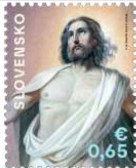
760) Peter Michal Bohúň (1822 – 1879): Nanebovstúpenie Krista, oltárny obraz z evanjelického kostola v Bátovciach (1873)

4. 3. 2022 * Veľká noc 2022: Kristologické motívy v diele P. M. Bohúňa (1822 – 1879) * príležitostná známka * GÚ: P. Nosál * OF Tiskárna Hradištko * PL: 50 ZP, TF: 2 PL (A); ZZ: 10 ZP (B), TF: 6 ZZ * papier FL (A), samolepiaci FL (B) * HZ 11¼ : 11¾ (A), vlnitý výsek 9¾ : 9½ (B) * FDC N: P. Nosál, OF BB print * náklad: A – 2 mil., B – 100 tis. (10 tis. ZZ)