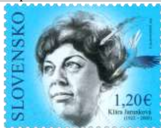
764) Klára Jarunková (1922 – 2005) – slovenská spisovateľka

28. 4. 2022 * Osobnosti: Klára Jarunková (1922 – 2005) * príležitostná známka * N: K. Slaninková * OF Tiskárna Hradištko * PL: 50 ZP, TF: 2 PL * papier FL * HZ 11¼ : 11¼ * FDC N: K. Slaninková, R: R. Cigánik, OTp Tiskárna Hradištko * náklad: 500 tis.