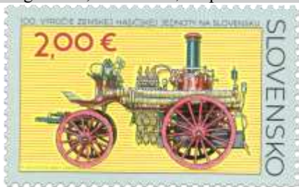
771) parná striekačka výrobcu Vilhelm Knaust, Wien z r. 1883

5. 8. 2022 * 100. výročie Zemskej hasičskej jednoty na Slovensku * príležitostná známka * N: P. Augustovič, R: J. Česla * OTp+OF Tiskárna Hradištko * PL: 10 ZP, TF: 1 PL * papier FL * RZ 11½ : 11¾ * FDC N: P. Augustovič, R: J. Česla, OTp Tiskárna Hradištko * náklad: 100 tis. (10 tis. PL)