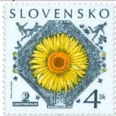
e) Symbolická kresba

1998, 5. 10. * Ekotopfilm - 25 rokov * príležitostná známka * N: I. Benca, R: F. Horniak * OTr+HT PTC * PL: 35 ZP, TF: 2 PL * papier -fld- * RZ 11 1/4 * PVSP 98/19/2-240, SM 98/6/30 * FDC N: I. Benca, R: F. Horniak, OTp PTC