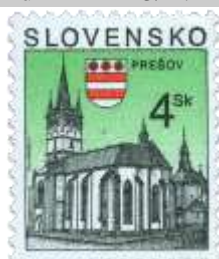
p) Kostol sv. Mikuláša v Prešove, mestský znak

1998, 3. 11. * Prešov * výplatná známka * N+R: F. Horniak * OTr+HT PTC * PL: 100 ZP, TF: 2 PL * papier - fľd- * RZ 11 3/4 : 11 1/4 * PVSP 98/22/5-279, SM 99/1/18 * FDC N: F. Horniak, OF Kníhtlač Gerthofer