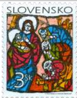
v) Viera Hložníková: Klaňanie troch kráľov

1998, 3. 11. * Vianoce '98 * príležitostná známka * GÚ+R: M. Činovský * OTr+HT PTC * PL: 50 ZP, TF: 2 PL * papier -fld- * RZ 11 1/4 : 11 1/2 * PVSP 98/21/1-263, SM 99/1/18 * FDC GÚ: M. Činovský, OF Kníhtlač Gerthofer