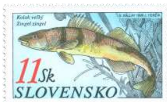
bb) Blatniak tmavý (Umbra krameri)