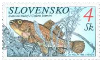
aa) Kolok veľký (Zingel zingel)

1998, 7. 9. * Ryby (Ochrana prírody) * príležitostné známky v hárčekovej úprave * N: D. Kállay, R: J. Herčík * OTp+OF PTC * TF: OF 1 HP, OTp 1 HP * papier -oz- * RZ 11 3/4 * PVSP 98/17/6-212, SM 98/6/28 * FDC N: D. Kállay, R: J. Herčík, OTp PTC