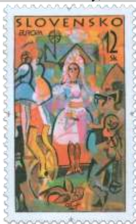
zz) Jozef Baláž (nar. 1923): Tekovská svadba (detail s postavou nevesty)

1998, 5. 5. * Folklorne slávnosti (Europa) * príležitostná známka * GÚ: M. Činovský, R: J. Herčík * OTp+OF P TC * PL: 8 ZP + 2 K, TF: OF 1 PL , OTp 1 PL * papier -oz- * RZ 11 3/4 * PVSP 98/9/1-105, SM 98/4/33 * FDC GÚ: M. Činovský, R: J. Herčík, OTp PTC *