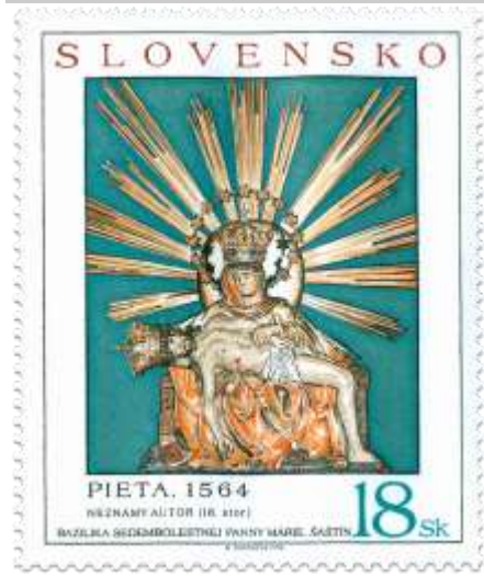
p) Súsošie piety z oltára Baziliky Sedembolestnej Panny Márie v Šaštíne

1998, 14. 9. * Sedembolestná Panna Mária (Umenie, prvá časť emisie) * príležitostná známka * GÚ: M. Činovský, R: M. Ondráček * OTp PTC * PL: a) 4 ZP + 2 K, b) 4 ZP + 1K * TF: 1 PL * papier -oz- * RZ 11 3/4 * PVSP 98/17/6-214, SM 98/6/30 * FDC GÚ: M. Činovský, R: M. Ondráček, OTp PTC