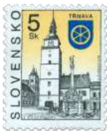
t) Mestská veža a súsosie Najsvätejšej trojice v Trnave