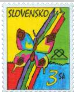
ee) L. Mereničová: Motýľ a dúha

1998, 1. 6. * Detské centrum * príležitostná známka realizovaná podľa návrhov detí * N: L. Mereničová (11 rokov), GÚ+R: M. Činovský * OTr+HT PTC * PL: 50 ZP, TF: 2 PL * papier -fls- * RZ 11 1/4 : 11 1/2 * PVSP 98/11/3-127, SM 98/5/30 * FDC N: I. Arbetová (9 rokov), N pečiatky: Z. Taščicová (4 roky), GÚ: M. Činovský, OF Kníhtlač Gerthofer