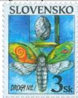
d) Symbolická kresba s motýľom smrtihlavom

1998, 5. 10. * Drogy nie! * príležitostná známka * N: A. Vojtášek, R: R. Cigánik * OTr+HT PTC * PL: 50 ZP, TF: 2 PL * papier -fld- * RZ 11 1/4 : 11 1/2 * PVSP 98/19/2-241, SM 98/6/31 * FDC N: A. Vojtášek, R: R. Cigánik, OTp PTC