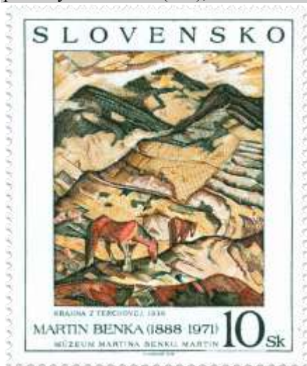
b) Martin Benka (1888-1971): Krajina z Terchovej