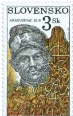
qq) Viktor Kolibík, vodca vzbury

1998, 1. 6. * Kragujevac 1918 * príležitostná známka * N+R: R. Cigánik * OTr+HT PTC * PL: 50 ZP, TF: 2 PL * papier -fld- * RZ 11 1/4 : 11 3/4 * PVSP 98/11/4-128, SM 98/5/30 * FDC N+R: R. Cigánik, OTr PTC