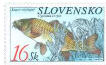
cc) Kapor obyčajný (Caprinus carpio)