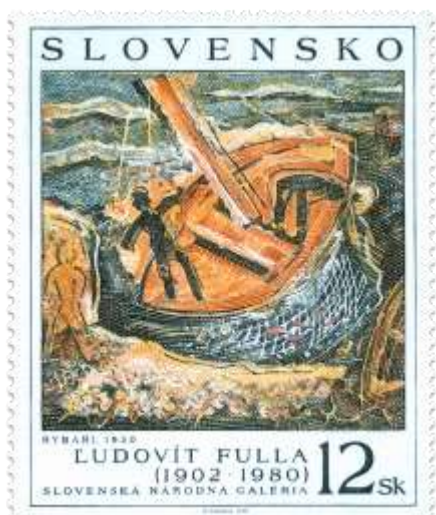
f) Ľudovít Fulla (1902-1980): Rybári