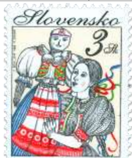
tt) Vynášanie Moreny

1998, 3. 3. * Eudové zvyky - vynášanie Moreny * príležitostná známka * N: K. Ševellová, R: R. Cigánik * OTr+HT PTC * PL: 50 ZP, TF 2 PL * papier -fld- * RZ 11 1/4 : 11 1/2 * PVSP 98/4/2-45, SM 98/3/29 * FDC N: K. Ševellová, R: R. Cigánik, OTp PTC