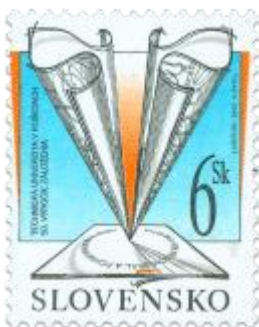
aa) Symbolická kresba technických výkresov

2002, 17. 10. * Technická univerzita v Košiciach * príležitostná známka * N: J. Haščák, R: K. Pavel * OTr+HT PTC * PL: 50 ZP, TF: 2 PL * papier -fls- * RZ 11 1/4 : 11 1/2 * PVSP, SM * FDC N: . Haščák, R: K. Pavel, OTp TAB