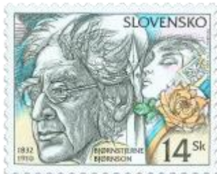
b) Bjornstjerne Bjornson (1832-1910), nórsky spisovateľ