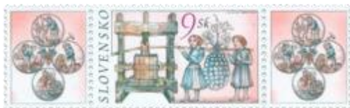
h) Lis na hrozno, symbol dožíniek