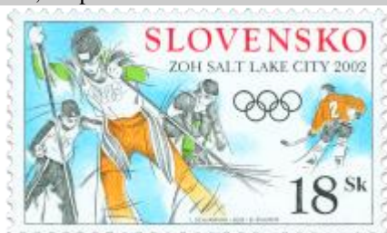
d) Predstavitelia zimných športov (zľava doprava: slalom, beh, zjazd a hokej)

2002, 25. 1. * ZOH Salt Lake City 2002 * príležitostná známka * N: I. Schurmann, R: B. Šneider * OTr+HT PTC * PL: 50 ZP, TF: 2 PL * papier -fls- * RZ 11 3/4 : 11 1/4 * PVSP, SM * FDC N: I. Schurmann, R: B. Šneider, OTr PTC