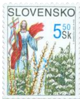
aa) Ján Krstiteľ, jarné kvety

2002, 15. 2. * Veľká noc * príležitostná známka * N: K. Ondreička, R: M. Srb * OTr+HT PTC * PL: 50 ZP, TF: 2 PL * papier -fls- * RZ 11 1/4 : 11 1/2 * PVSP, SM * FDC N: K. Ondreička, R: M. Srb, OTp PTC