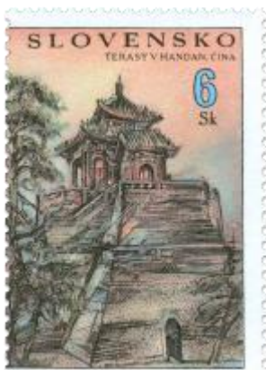
xx) Terasy v meste Handan