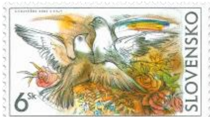
d) Symbolická kresba

2002, 4. 7. * Blahoželanie * príležitostná známka * N: A. Vojtášek, R: V. Fajt * OTr+HT PTC * PL: 12 ZP + 12 KP, TF: 2x2 PL * papier -fls- * RZ 11 3/4 : 11 1/4 * PVSP, SM * FDC N: A. Vojtášek, R: V. Fajt, OTp PTC * tri varianty PL - s kupónom potlačeným logom výstavy „SLOVENSKO 2002“ (a), s personalizovaným kupónom (b) alebo s prázdnyim kupónom (c)