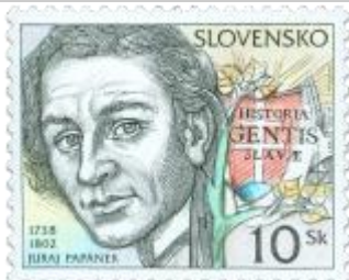
a) Juraj Papánek (1738-1802), historik