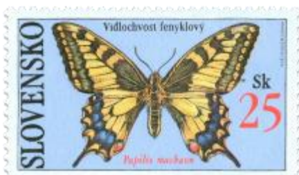
269: Vidlochvost fenyklový (Papilio machaon)