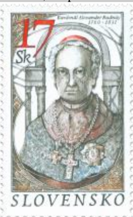
270: Kardinál Alexander Rudnay (1760-1831)