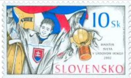
d) Hokejista s pohárom pre majstra sveta

2002, 4. 7. * Majster sveta v ľadovom hokeji 2002 * príležitostná známka * N: I. Schurmann, GÚ a RR: M. Činovský, R: F. Horniak * OTr+HT PTC * PL: 50 ZP, TF: 2 PL * papier -fls- * RZ 11 3/4 : 11 1/4 * PVSP, SM * FDC N: I. Schurmann, OF Gerthofer