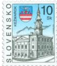
p) Radnica v Kežmarku, mestský erb

2002, 6. 5. * Kežmarok * výplatná známka * N+R: F. Horniak * OTr+HT PTC * PL: 100 ZP, TF: 2 PL * papier -fls- * RZ 11 3/4 : 11 1/4 * PVSP, SM * FDC N: F. Horniak, OF GH