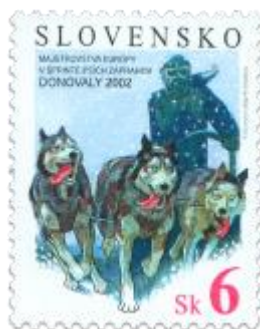
aa) Psí záprah

2002, 8. 2. * ME v šprinte psích záprahov, Donovaly 2002 * príležitostná známka * N: P. Uchnár, R: R. Cigánik * OTr+HT PTC * PL: 50 ZP, TF: 2 PL * papier -fls- * RZ 11 1/4 : 11 1/2 * PVSP, SM * FDC N: P. Uchnár, R: R. Cigánik, OTp PTC