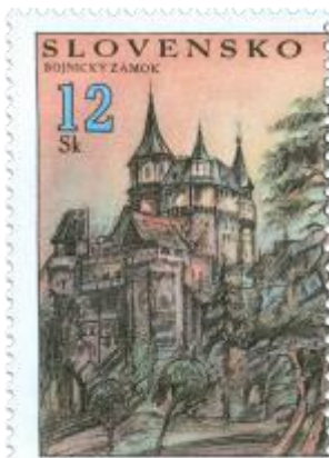
yy) Bojnický zámok