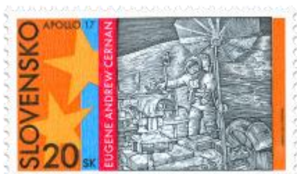
J) známka - lunárny modul na povrchu Mesiaca, kupón - Apollo 17