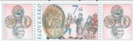
g) Sud na víno, pitie vína

2002, 24. 6. * Staré výrobné vinárske nástroje, vinársky život (Technické pamiatky) * príležitostné známky * N: D. Kállay, R: V. Fajt * OTr+HT PTC * PL: 30 ZP + 40 K, TF: 2 PL * papier -fls- * RZ 11 3/4 : 11 1/4 * * FDC N: D. Kállay, R: V. Fajt, OTp PTC