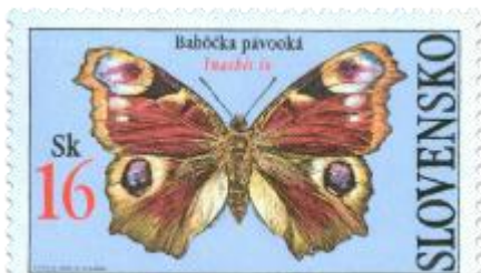
268: Bábôčka pávooká (Inachis io)