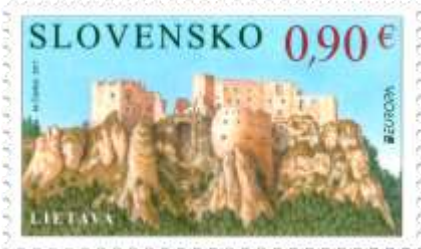
635) Hrad Lietava

2017, 5. 5. * Hrady a zámky – Lietava (Europa) * príležitostná známka * N: M. Čapka * OF PTC * PL: 8 ZP (A), TF: 8 PL ; ZZ: 6 ZP (B), TF: 3 ZZ * papier FL (A), samolepiaci FL (B) * KHZ 11 ¾ : 11 ¼ (A), vlnitý výsek 16 ¼ : 15 (B) * FDC N: M. Čapka, OF Kasico * náklad: A - 200 tis. (25 tis. PL), B - 90 tis. (15 tis. ZZ)