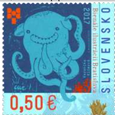
638) Ilustrácia V. Klimovej

2017, 4. 9. * Bienále ilustrácií Bratislava 2017 * príležitostná známka * GÚ: V. Rostoka * OF PTC * PL: 35 ZP, TF: 2 PL * papier FL * KHZ 12 * FDC GÚ: V. Rostoka OF Kasico * náklad: 350 tis.