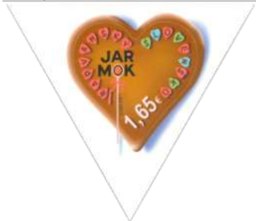
640) Perníkové srdce z jarmoku

2017, 8. 9. * Radvanský jarmok * príležitostná známka * N: P. Uchnár * OF Kasico * PL: 30 ZP + 10 K, TF: 2 PL * samolepiaci papier FL * výsek, ZP a kupóny na PL oddelené čiarkovým priesekom 4 1/8 * FDC N: P. Uchnár, OF Kasico * náklad: 450 tis.