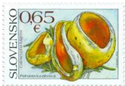
643) Pohárovka ohnivá ( Caloscypha fulgens )