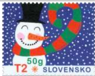
647) Detská kresba snehuliaka

2017, 10. 11. * Vianočná pošta 2017 * príležitostná známka * N: B. Ďuríková, GÚ: V. Rostoka * OF Tiskárna Hradištko * PL: 50 ZP, TF: 2 PL * papier BP * HZ 13 ½ * FDC N: S. Tadanaiová, NP: V. Csábiová, OF Kníhtlač Gerthofer * náklad: 1 mil.