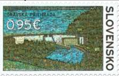
634) Hrádza Oravskej priehrady

2017, 21. 4. * Oravská priehrada (Technické pamiatky) * príležitostná známka * N: M. Komáček, R: F. Horniak * OTr+HT PTC * PL: 50 ZP, TF: 2 PL * papier FLA * RZ 11 ¾ : 11 ¼ * FDC N: M. Komáček, R: F. Horniak, OTp PTC * náklad: 1 mil.