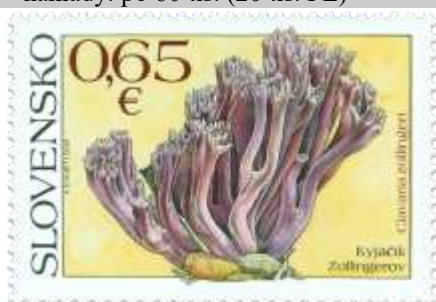
642) Kyjačík Zollingerov ( Clavaria zollingeri )

2017, 12. 10. * Huby (Ochrana prírody) * príležitostné známky * N: K. Felix, R: J. Česla * OTp+OF PTC * PL: 3 ZP + 3 ZP, TF: OF 1 PL, OTp 1 PL * papier FLA * RZ 11 ½ : 11 ¾ * FDC N: K. Felix, R: J. Česla, OTp PTC * náklady: po 60 tis. (20 tis. PL)