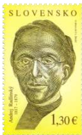
637) Andrej Radlinský (1817 – 1879)