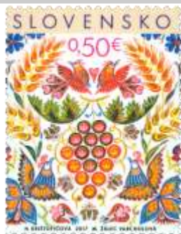
648: H. Krištofičová: Vajnorská ľudová maľba so symbolikou darov prírody na sviatočnom stole

2017, 16. 11. * Vianoce 2017: Vajnorská ľudová maľba * príležitostná známka * N: H. Krištofičová, GÚ: M. Žálec Varcholová * OF Tiskárna Hradištko * PL: 50 ZP, TF: 2 PL (A); ZZ: 10 ZP (B), TF: 3 ZZ * papier BP (A), samolepiaci BP (B) * HZ 13 ½ (A), vlnitý výsek 9 ¾ : 9 ½ (B) * FDC N: M. Žálec Varcholová, OF Kníhtlač Gerthofer * náklad: 1,7 mil. (A), 325 tis. (B), 32,5 tis. ZZ)