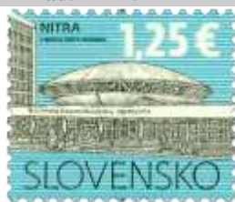
628) Slovenská poľnohospodárska univerzita v Nitre

2017, 9. 1. * Kultúrne dedičstvo Slovenska: Nitra * výplatná známka * N: I. Benca, R: F. Horniak * OTr+HT PTC * PL: 100 ZP, TF: 2 PL * papier FLA * RZ 11 ¼ : 11 ¾ * FDC N: I. Benca, R: F. Horniak, OTr PTC * náklad: 2 mil.