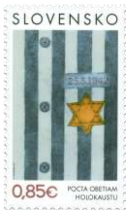
633) Symbolická kresba