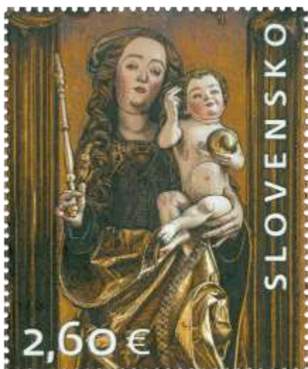
645) Panna Mária s Ježišom