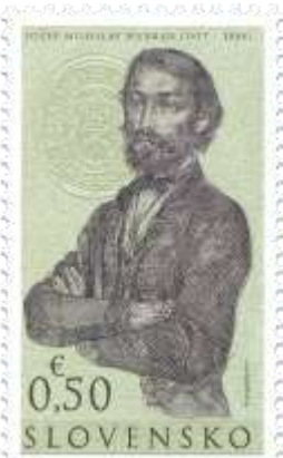
631) Jozef Miloslav Hurban (1817 –1888) – slovenský národovec, evanjelický kňaz, politik, novinár, literárny kritik a spisovateľ