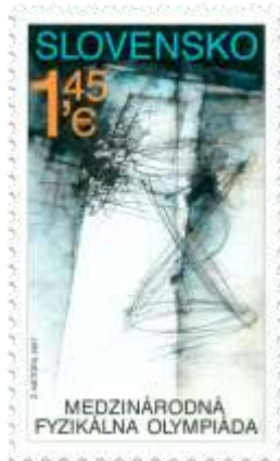
629) Symbolická kresba

2017, 10. 2. * Medzinárodná fyzikálna olympiáda * príležitostná známka * N: Z. Netopil * OF PTC * PL: 50 ZP, TF: 4 PL * papier FL * KHZ 11 ¼ : 11 ¾ * FDC N: Z. Netopil, R: Ľ. Žálec, OTr PTC * náklad: 1,5 mil.