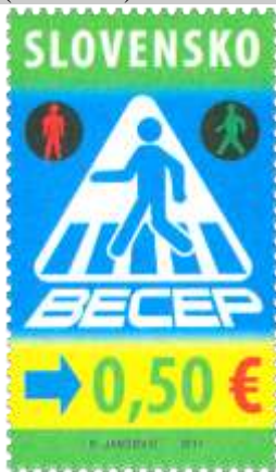
649) Symbolická kresba

2017, 24. 11. * Bezpečnosť cestnej premávky * príležitostná známka * N: R. Jančovič * OF Tiskárna Hradištko * PL: 10 ZP, TF: 4 PL * papier BP * HZ 13 ½ * FDC N: R. Jančovič, R: L. Žálec, OTp PTC * náklad: 200 tis. (20 tis. PL)