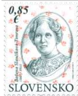
641) Božena Slančíková – Timrava (1867 – 1951) – slovenská spisovateľka