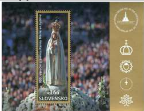
630) Procesia so sochou Panny Márie Fatimskej

2017, 13. 3. * 100. výročie zjavenia Panny Márie vo Fatime * príležitostná známka v háččkovej úprave, spoločné vydanie s Portugalskom, Poľskom a Luxemburskom * N: Atelier Design & Etc. * OF PTC * H: 1 ZP, TF: 8 H * papier FL * RZ 12 * FDC R: L. Žálec, OTr PTC * náklad: 80 tis.