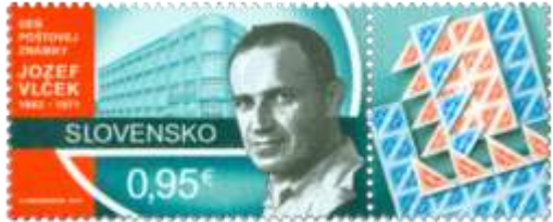
650) Jozef Vlček (1902 – 1971) – slovenský výtvarník

2017, 4. 12. * Jozef Vlček (1902 – 1971) (Deň poštovej známky) * príležitostná známka * N: P. Augustovič * OF Tiskárna Hradištko * PL: 30 ZP + 30 K, TF: 2 PL * papier BP * HZ 13 ½ * FDC N: P. Augustovič, R: F. Horniak, OTp PTC * náklad: 600 tis.