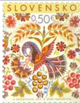
632) H. Krištofičová: Vajnorská ľudová maľba so symbolikou sebaobetovania

2017, 24. 3. * Veľká noc 2017: Vajnorská ľudová maľba * príležitostná známka * N: H. Krištofičová, GÚ: M. Žálec Varcholová * OF PTC * PL: 50 ZP (A), TF: 4 PL; ZZ: 10 ZP (B), TF: 6 ZZ * papier FL (A), samolepiaci FL (B) * KHZ 11 ¼ : 11 ¾ (A), pílkovitý výsek 10 : 10 ¼ (B) * FDC N: M. Žálec Varcholová, OF Kasico * náklad: 1,7 mil. (A), 300 tis. (B, 30 tis. ZZ)