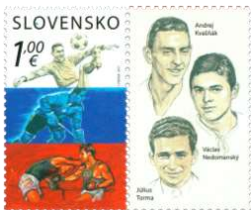
639) Futbalista A. Kvašňák (1936-2007), hokejista V. Nedomaňský