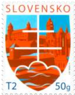
636) Štylizovaný štátny znak SR s dominantami Bratislavy a Košíc

2017, 2. 6. * Štátny motív - známka s personalizovaným kupónom * príležitostná známka určená na personalizáciu kupónu * N: A. Ferda * OF PTC * PL: 8 ZP + 8 K, TF: 8 PL (5 s kupónmi „Art Film Fest Košice“ + 3 s nepotlačenými kupónmi) * papier FL * HZ 11 ¼ : 11 ¾ * FDC N: A. Ferda, OF Kasico * náklad: 260 tis. (32,5 tis. PL, z toho 22,5 tis. PL s kupónom „Art Film Fest Košice“ a 10 tis. PL s nepotlačeným kupónom)