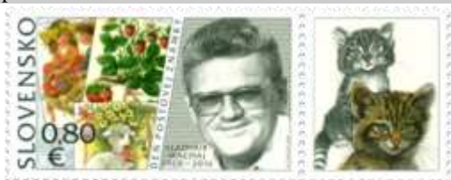
729) portrét a ukážky známkovej tvorby V. Machaja

4. 12. 2020 * Deň poštovej známky: Vladimír Machaj (1930 – 2016) * príležitostná známka * N: M. Činovský * OF Tiskárna Hradištko * PL: 30 ZP + 30 K, TF: 2 PL * papier FL * HZ 13 ½ * FDC GÚ: M. Činovský, OF BB print * náklad: 600 tis.