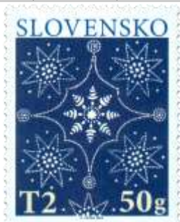
728) vianočné vzory slovenskej modrotlače

13. 11. 2020 * Vianoce 2020: Tradičná slovenská modrotlač * príležitostná známka * N: A. Ferda * OF Tiskárna Hradištko * PL: 50 ZP, TF: 2 PL (A); ZZ: 10 ZP (B), TF: 6 ZZ * papier FL (A), samolepiaci FL (B) * HZ 11 ¼ : 11¾ (A), vlnitý výsek 9 ¾ : 9 ½ (B) * FDC * N: A. Ferda, OF BB print * náklad: A – 2 mil., B – 56 tis. ( 5,6 tis. ZZ)