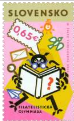
714) symbolická kresba

5. 6. 2020 * Filatelistická olympiáda * príležitostná známka * N: M. Žálec Varcholová * OF Tiskárna Hradištiko * PL: 50 ZP, TF: 2 PL * papier FL * KHZ 11 ¼ : 11 ¾ * FDC N: M. Žálec Varcholová, OF BB print * náklad: 1 mil.