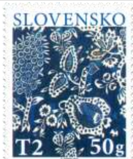
708) kvetinové vzory slovenskej modrotlače

13. 3. 2020 * Veľká noc 2020: Tradičná slovenská modrotlač * príležitostná známka * N: A. Ferda * OF Tiskárna Hradištko * PL: 50 ZP, TF: 2 PL (A); ZZ: 10 ZP (B), TF: 6 ZZ * papier FL (A), samolepiaci BP (B) * HZ 13 ½ (A), vlnitý výsek 9 ¾ : 9 ½ (B) * FDC N: A. Ferda, OF BB print * náklad: A – 2 mil., B – 63 tis. ( 6,3 tis. ZZ)