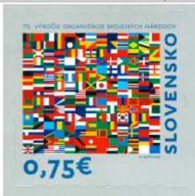
706) vlajky členských štátov OSN

14. 2. 2020 * 75. výročie Organizácie spojených národov * príležitostná známka * N: M. Benčík * OF Tiskárna Hradištko * PL: 35 ZP, TF: 2 PL * samolepiaci papier BP * vlnitý výsek, ZP na PL oddelené čiarkovým priesečkom 5 * FDC N: M. Benčík, OF BB print * náklad: 770 tis.