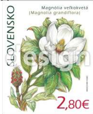
715) Magnólia veľkokvetá ( Magnolia grandiflora )

17. 6. 2020 * Ochrana prírody: Botanická záhrada v Košiciach – magnólia veľkokvetá * príležitostná známka v hářčekovej úprave * N: I. Benca, R: R. Cigánik * OTp+OF Tiskárna Hradištiko * H: 1 ZP, TF: 1 H * papier FL * RZ 11 ¾ * FDC N: I. Benca, R: R. Cigánik, OTp Tiskárna Hradištiko * náklad: 50 tis.