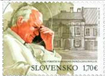
713) pápež Ján Pavol II. (1920 – 2005), rodný dom pápeža vo Wadowiciach

18. 5. 2020 * 100. výročie narodenia pápeža Jána Pavla II. (1920 – 2005) * príležitostná známka, spoločné vydanie s Poľskom * N: M. Jędrzyk, LR: G. Gałązki * OF Tiskárna Hradištko * PL: 6 ZP + 6 K, TF: 4 PL * papier FL * HZ 13 ½ * FDC N+R: L. Žálec, OTp Tiskárna Hradištko * náklad: 180 tis. (30 tis. PL)