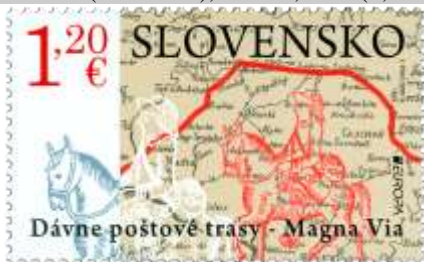
711) mapa úseku poštovej trasy Magna Via, spájajúcej Viedeň so Sedmohradskom (16. stor.)

30. 4. 2020 * EUROPA 2020: Dávne poštové trasy – Magna Via * príležitostná známka * N: L. Paľo * OF Tiskárna Hradištko * PL: 8 ZP (A), TF: 8 PL; ZZ: 6 ZP (B), TF: 6 ZZ * papier FL (A), samolepiaci BP (B) * HZ 13 ½ (A), vlnitý výsek 9 ¾ : 9 ½ (B) * FDC N: L. Paľo, R: J. Česla, OTp Tiskárna Hradištko * náklad: A – 160 tis. (20 tis. PL), B – 43,2 tis. (7,2 tis. ZZ)