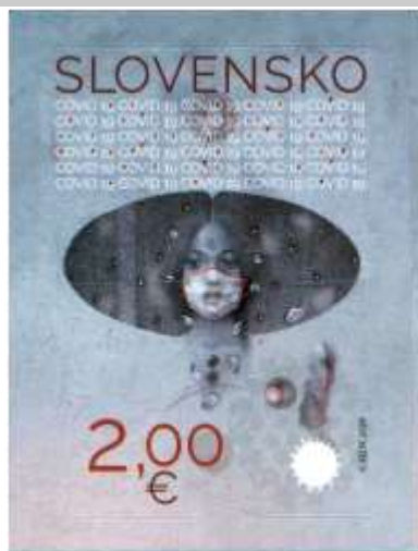
718) symbolická kresba dievčat'a s rúškom

21. 8. 2020 * COVID-19 * príležitostná známka * N: K. Felix * OF + serigrafia s použitím reliéfného nárazového UV laku, Tiskárna Hradištiko * PL: 25 ZP, TF: 2 PL * samolepiaci papier FL * výsek s nepravidelným výrezom v dolnej časti známky, ZP na PL oddelené čiarkovým prieseikom 6 * FDC N: K. Felix OF BB print * náklad: 1 mil.