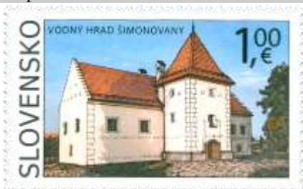
720) goticko-renesančný kaštieľ Vodný hrad v Šimonovanoch (15. stor.)

4. 9. 2020 * Krásky našej vlasti: Kaštieľ Vodný hrad v Šimonovanoch * príležitostná známka * N+R: F. Horniak * OTp+OF Tiskárna Hradištko * PL: 8 ZP, TF: 1 PL * papier FL * RZ 13 ½ : 14 * FDC N+R: F. Horniak, OTp Tiskárna Hradištko * náklad: 240 tis. (30 tis. PL)