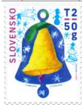
727) vianočný zvonec a ďalšie symboly Vianoc

13. 11. 2020 * Vianočná pošta 2020 * príležitostná známka * N: S. Drbúlová, A. Patakyová, GÚ: V. Rostoka * OF Tiskárna Hradištko * PL: 50 ZP, TF: 2 PL * papier FL * HZ 11 ¼ : 11¾ * FDC N: A. Potúčková, NP: M. Gallo, GÚ: V. Rostoka, OF BB print * náklad: 1 mil.