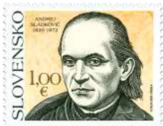
710) Andrej Sládkovič (1820 – 1872) – slovenský básnik