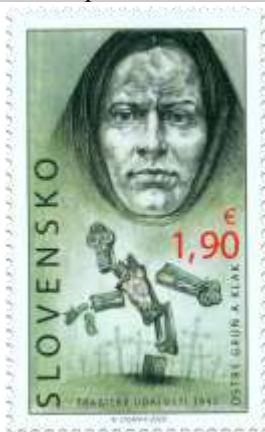
705) symbolická kresba

17. 1. 2020 * 75. výročie tragických udalostí v obciach Ostrý Grúň a Kľak * príležitostná známka * N+R: R. Cigánik * OTp+OF Tiskárna Hradištko * PL: 10 ZP, TF: 1 PL * papier FL * RZ 14: 13 ½ * FDC N+R: R. Cigánik, OTp Tiskárna Hradištko * náklad: 200 tis. (20 tis. PL)