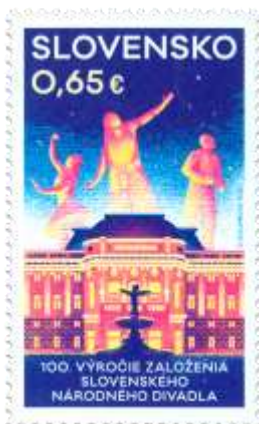
707) stará budova SND, divadelné postavy