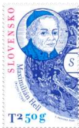
712) Maximilián Hell (1720 – 1792) – astronóm

K) znázornenie prechodu Venuše pred slnečným diskom a výpočtu vzdialenosti Zeme od Slnka