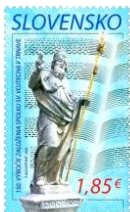
721) socha sv. Vojtecha pred kostolom sv. Mikuláša v Trnave