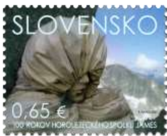
746) Horolezec v bivaku