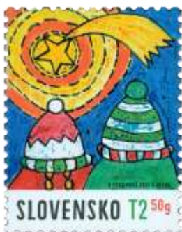
752) vianočná kométa a deti