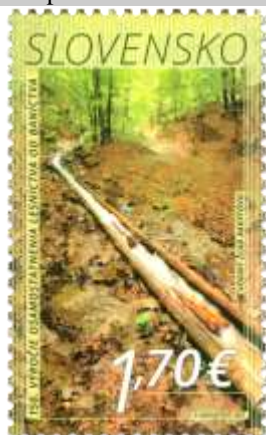
745) Transport dreva vo vodnom žľabe Rakytovo

1. 7. 2021 * 150. výročie osamostatnenia lesníctva od baníctva (1871) * príležitostná známka * N: P. Augustovič * OF Tiskárna Hradištko * PL: 30 ZP, TF: 3 PL * papier FL * HZ 11 ¾ * FDC N: P. Augustovič, OF BB print * náklad: 300 tis.