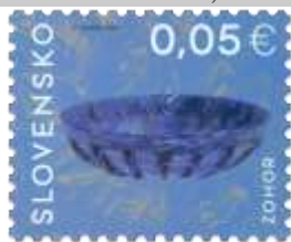
730) Sklenená misa z rímskej doby

4. 1. 2021 * Úžitkové umenie na Slovensku: Rímske sklo zo Zohora * výplatná známka * N: P. Nosál * OF+serigrafia Tiskárna Hradištko * PL: 100 ZP, TF: 1 PL (spoločne s 732) * papier FL * HZ+RZ 11 ¼ : 11 ¾ * FDC N: P. Nosál, OF BB print * náklad: 1 mil.