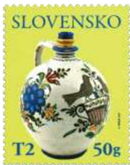
736) Modranský džbán „čepák“ s motívmi rastlín a vtáčikov