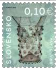
731) Gotický pohár so sklenenými nálepmi (15. stor.)

4. 1. 2021 * Úžitkové umenie na Slovensku: Gotický pohár s nálepmi z Bratislavy * výplatná známka * N: P. Nosál * OF+serigrafia Tiskárna Hradištiko * PL: 100 ZP, TF: 2 PL * papier FL * HZ+RZ 11 ¾ : 11 ¼ * FDC N: P. Nosál, OF BB print * náklad: 1,5 mil.