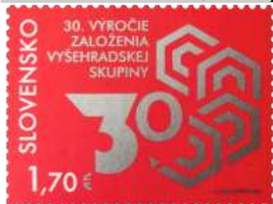
735) Symbolická kresba

15. 2. 2021 * 30. výročie založenia Vyšehradskej skupiny * príležitostná známka, spoločné vydanie s Poľskom, Maďarskom a ČR * N: A. Sobczyńska * OF Tiskárna Hradištko * PL: 9 ZP, TF: 2 PL * papier FL * HZ 12 * FDC N: A. Ferda, OF BB print * náklad: 180 tis. (20 tis. PL)