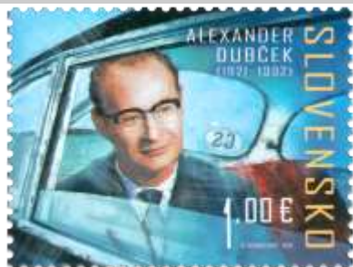
754) Alexander Dubček (1921-1992), politik