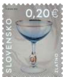
732) Pohár na sekt „Zlatá Zuzana“ (1956)