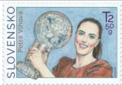
751) Petra Vlhová (nar. 1995) – slovenská zjazdová lyžiarka

3. 11. 2021 * Petra Vlhová - Svetový pohár v alpskom lyžovaní 2020/21 * príležitostná známka * N: K. Felix * OF Tiskárna Hradištko * PL: 50 ZP, TF: 2 PL * papier FL * HZ 12 * FDC N: K. Felix, OF BB print * náklad: 1 mil.