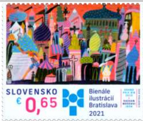
747) Hassan Mosavi: ilustrácia z knihy Boxer

3. 9. 2021 * Bienále ilustrácií Bratislava 2021 * príležitostná známka * N: V. Rostoka * OF Tiskárna Hradištko * PL: 25 ZP, TF: 2 PL * papier FL * HZ 11 \frac{1}{4} : 11 \frac{3}{4} * FDC N: V. Rostoka, OF BB print * náklad: 250 tis.