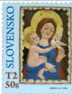
753) I. Bizmayer (1922 – 2019) – keramický reliéf „Madona“ (1986)

12. 11. 2021 * Vianoce 2021: Ľudová fajansa * príležitostná známka * N: A. Ferda * OF Tiskárna Hradištko * PL: 50 ZP, TF: 1 PL (A - spoločne s 752); ZZ: 10 ZP (B), TF: 6 ZZ * papier FL (A), samolepiaci BP (B) * HZ 11 ¼ : 11 ¾ (A), vlnitý výsek 9 ¾ : 9 ½ (B) * FDC * N: A. Ferda, OF BB print * náklad: A – 1 mil., B – 100 tis. (10 tis. ZZ)