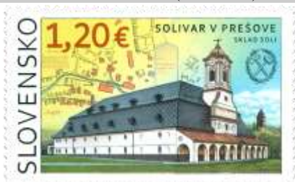
743) Sklad soli v Solivare v Prešove, mapa zariadení

11. 6. 2021 * Technické pamiatky: Solivar v Prešove * príležitostná známka * N+R: J. Česla * OTp+OF Tiskárna Hradištko * PL: 6 ZP, TF: 1 PL * papier FL * RZ 13 ½ : 14 * FDC N+R: J. Česla, OTp Tiskárna Hradištko * náklad: 60 tis. (10 tis. PL)