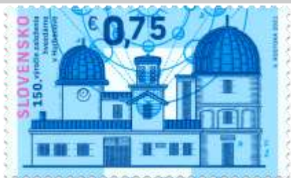
742) Hvezdáreň v Hurbanove

21. 5. 2021 * 150. výročie založenia hvezdárne v Hurbanove * príležitostná známka * N: V. Rostoka * OF Tiskárna Hradištko * PL: 40 ZP + 10 K, protichodné usporiadanie 20 ZP + 5 K / 5 K + 20 ZP, TF: 2 PL * papier FL * HZ 11 ¾ : 11 ¼ * FDC N: V. Rostoka, OF BB print * náklad: 400 tis.