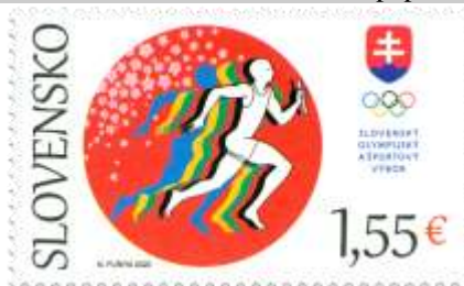
738) Symbolika štafetového behu, kvetov sakury a japonskej vlajky, logo

14. 4. 2021 * XXXII. letné olympijské hry v Tokiu * príležitostná známka * N: N. Furyia * OF Tiskárna Hradištko * PL: 50 ZP, TF: 2 PL * papier FL * HZ 13 ½ * FDC N: N. Furyia, OF BB print * náklad: 1 mil.