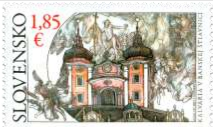
749) Kalvária v Banskej Štiavnici (18. stor.)

10. 9. 2021 * Krásy našej vlasti: Kalvária v Banskej Štiavnici * príležitostná známka * N: D. Kállay, R: F. Horniak * OTp+OF Tiskárna Hradištko * PL: 8 ZP, TF: 1 PL * papier FL * RZ 11 ¾ * FDC N: D. Kállay, R: F. Horniak, OTp Tiskárna Hradištko * náklad: 120 tis. (15 tis. PL)