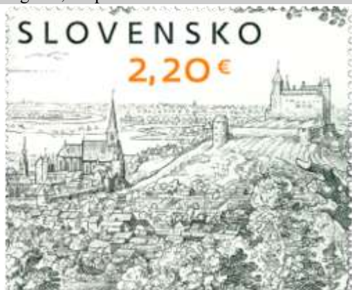
750) Matthäus Merian (1593 – 1650): Pohľad na Bratislavu

18. 10. 2021 * UMENIE: Matthäus Merian (1593 – 1650) * príležitostná známka v hárčekovej úprave * N+R: R. Cigánik * OTp+OF Tiskárna Hradištko * H: 1 ZP, TF: 1 H * papier FL * RZ 11 ¾ * FDC N+R: R. Cigánik, OTp Tiskárna Hradištko * náklad: 50 tis.