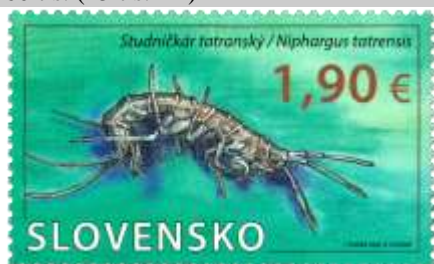
744) Studničkár tatranský ( Niphargus tatrensis )

30. 6. 2021 * Ochrana prírody: Demänovská jaskyňa slobody – Studničkár tatranský * príležitostná známka * N: I. Piačka, R: R. Cigánik * OF (známka), OTp+OF (pohľad na jaskyňu) Tiskárna Hradištko * PL: 4 ZP, TF: 1 PL * papier FL * RZ 13 ½ : 14 * FDC N: I. Piačka, R: R. Cigánik, OTp Tiskárna Hradištko * náklad: 60 tis. (15 tis. PL)