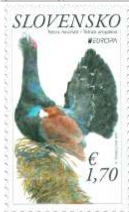
741) Tetrov hlucháň ( Tetrao urogallus )

7. 5. 2021 * EUROPA 2021: Tetrov hlucháň * príležitostná známka * N: K. Štanclová * OF Tiskárna Hradištko * PL: 8 ZP (A), TF: 6 PL; ZZ: 6 ZP (B), TF: 6 ZZ * papier FL (A), samolepiaci FL (B) * HZ 11 ¼ : 11 ¼ (A), výsek 9 ¾ : 9 ½ (B) * FDC N: K. Štanclová, R. F. Horniak, OTp Tiskárna Hradištko * náklad: A – 160 tis. (20 tis. PL), B – 30 tis. (5 tis. ZZ)