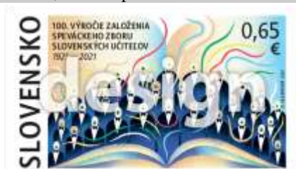
737) Symbolická kresba

13. 3. 2021 * 100. výročie založenia Speváckeho zboru slovenských učiteľov * príležitostná známka * N: D. Olejníková * OF Tiskárna Hradištko * PL: 50 ZP, TF: 2 PL * papier FL * HZ 11 ¾ : 11 ¼ * FDC N: D. Olejníková, OF BB print * náklad: 250 tis.