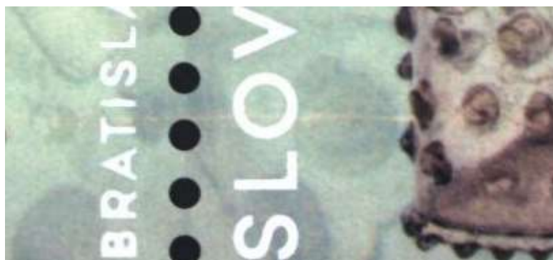
Detail ZP N1/2/14-15