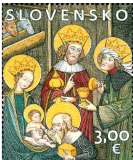
755) Klaňanie troch kráľov zo Zlatých Moraviec (okolo r. 1450)