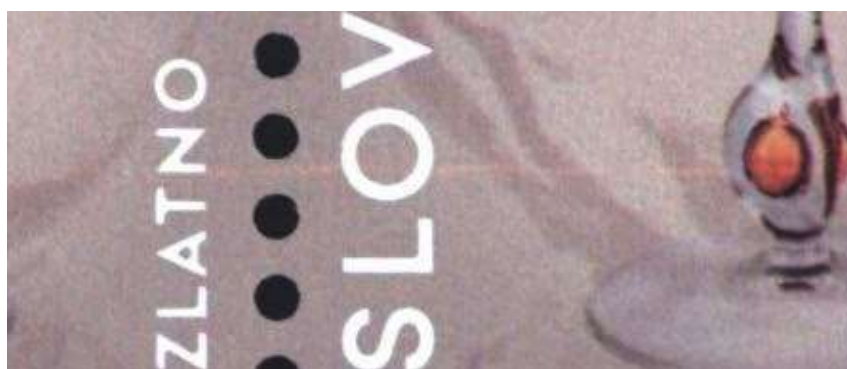
Detail ZP N1/14-15