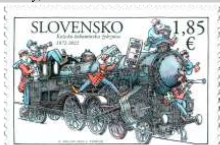
761 a dolný kupón) parné rušne používané na Košicko-bohumínskej železnici s postavičkami železničných profesií a cestujúcich horný kupón) parný rušeň používaný na ozubnicovej železnici Štrba-Štrbské Pleso háčček) mapa rakúsko-uhorských železníc, historické logotypy železníc

18. 3. 2022 * Spoločné vydanie s Českou republikou: 150. výročie uvedenia do prevádzky Košicko-bohumínskej železnice * príležitostná známka v háččkovej úprave, spoločné vydanie s ČR * N: D. Kállay, R: J. Tvrdoň * OTp+OF Tiskárna Hradištko * H: 1 ZP + 2 K, TF: 1 H * papier FL * RZ 11½ : 11¾ * FDC N: D. Kállay, OF Tiskárna Hradištko * náklad: 49 tis.