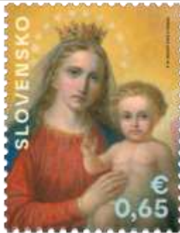
781) Peter Michal Bohún (1822 – 1879): Kráľovná nebies, detail oltárneho obrazu

11. 11. 2022 * Vianoce 2022: Kristologické motívy v diele P. M. Bohúňa (1822 – 1879) * príležitostná známka * GÚ: P. Nosál * OF Tiskárna Hradištiko * PL: 50 ZP, TF: 2 PL (A); ZZ: 10 ZP (B), TF: 6 ZZ * papier FL (A), samolepiaci FL (B) * HZ 11¼ : 11¼ (A), vlnitý výsek 9¼ : 9½ (B) * FDC N: P. Nosál, digitálna tlač Tiskárna Hradištiko * náklad: A – 500 tis., B – 100 tis. (10 tis. ZZ)