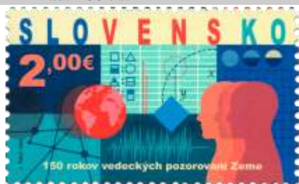
766) symbolická kresba