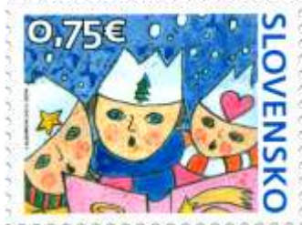
780) detská kresba troch koledníkov

11. 11. 2022 * Vianočná pošta 2022 * príležitostná známka * N: V. Bubeníková, GÚ: A. Ferda * OF Tiskárna Hradištiko * PL: 50 ZP, TF: 2 PL * papier FL * HZ 11¼ : 11¼ * FDC N: K. Gubienová, NP: N. A. Samai, GÚ: A. Ferda, digitálna tlač Tiskárna Hradištiko * náklad: 1 mil.