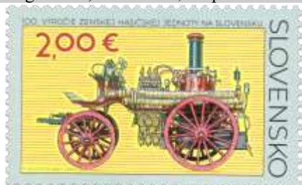
771) parná striekačka výrobcu Vilhelm Knaust, Wien z r. 1883

5. 8. 2022 * 100. výročie Zemskej hasičskej jednoty na Slovensku * príležitostná známka * N: P. Augustovič, R: J. Česla * OTp+OF Tiskárna Hradištko * PL: 10 ZP, TF: 1 PL * papier FL * RZ 11½ : 11¾ * FDC N: P. Augustovič, R: J. Česla, OTp Tiskárna Hradištko * náklad: 100 tis. (10 tis. PL)