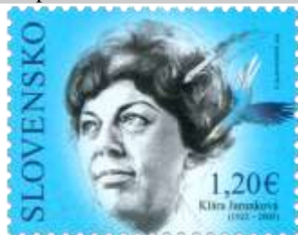
764) Klára Jarunková (1922 – 2005) – slovenská spisovateľka

28. 4. 2022 * Osobnosti: Klára Jarunková (1922 – 2005) * príležitostná známka * N: K. Slaninková * OF Tiskárna Hradištko * PL: 50 ZP, TF: 2 PL * papier FL * HZ 11¼ : 11¼ * FDC N: K. Slaninková, R: R. Cigánik, OTp Tiskárna Hradištko * náklad: 500 tis.