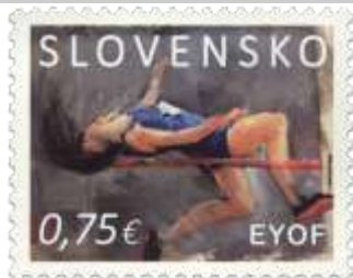
770) skokanka do výšky

23. 7. 2022 * Šport: Európsky olympijský festival mládeže (EYOF) * príležitostná známka * N: J. Matiová * OF+serigrafia Tiskárna Hradištko * PL: 50 ZP, TF: 2 PL * papier FL * HZ 11¾ : 11¼ * FDC N: J. Matiová, OF Tiskárna Hradištko * náklad: 1 mil.