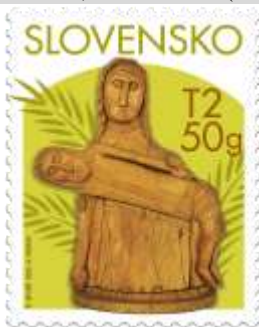
787) Štefan Sivák st. (1906 – 1995): Pieta

24. 2. 2023 * Veľká noc 2023: Slovenské ľudové rezbárstvo * príležitostná známka * GÚ: A. Ferda * OF Tiskárna Hradištiko * PL: 50 ZP, TF: 2 PL (A); ZZ: 10 ZP (B), TF: 6 ZZ * papier FL (A), samolepiaci FL (B) * HZ 11¼ : 11¼ (A), vlnitý výsek 9¼ : 9¼ (B) * FDC N: A. Ferda, digitálna tlač Tiskárna Hradištiko * náklad: A – 250 tis., B – 100 tis. (10 tis. ZZ)