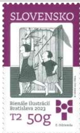
799) ilustrácia E. Odriozoly

8. 9. 2023 * Bienále ilustrácií Bratislava 2023 * príležitostná známka * N: M. Menke, RR: J. Česla * OF Tiskárna Hradištko * PL: 50 ZP v protichodnom usporiadaní riadkov známok, TF: 2 PL * papier FL * KHZ 11¼ : 11¼ * FDC N: M. Menke, R: J. Česla, OTp Tiskárna Hradištko * náklad: 1 mil.