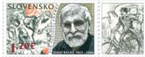
809) Jozef Baláž (1923 – 2006), slovenský grafik a ilustrátor,

5. 12. 2023 * Deň poštovej známky: Jozef Baláž (1923 – 2006) * príležitostná známka * N+RR: M. Činovský * OF + dvojfarebná serigrafia Tiskárna Hradištko * PL: 30 ZP + 30 K, TF: 2 PL * papier FL * KHZ 11¾ : 11¼ * FDC N+R: M. Činovský, OTp Tiskárna Hradištko * náklad: 300 tis.