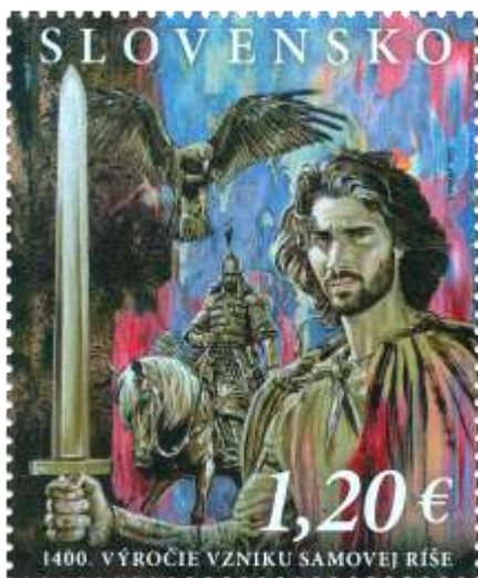
804) symbolická kresba bojovníkov