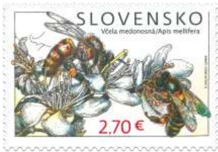
796) Včela medonosná ( Apis mellifera )