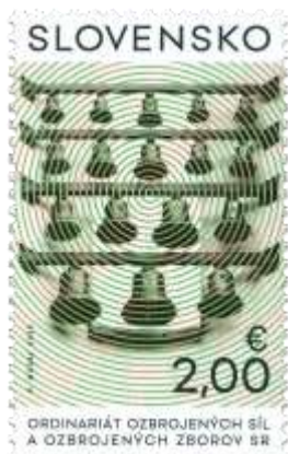
790) zvonkohra Katedrály sv. Šebastiána v Bratislave – Rači