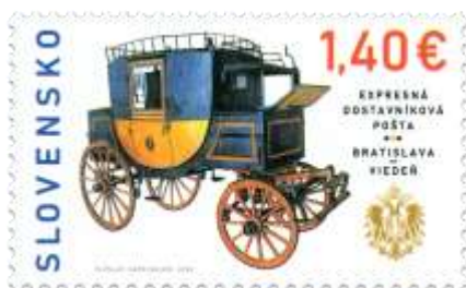
794) rýchlvoz M. Ottenfelda (19. stor.)