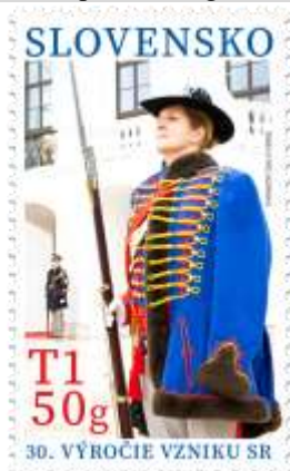
784) členka čestnej stráže pred prezidentským palácom

2. 1. 2023 * 30. výročie vzniku SR - Čestná stráž Prezidenta SR * príležitostná známka * N: A. Ferda podľa fotografie P. Konečného * OF Tiskárna Hradištko * PL: 10 ZP, TF: 6 PL * papier FL * RZ 11¼ * FDC N: A. Ferda podľa fotografie P. Konečného, digitálna tlač Tiskárna Hradištko * náklad: 70 tis. (7 tis PL)