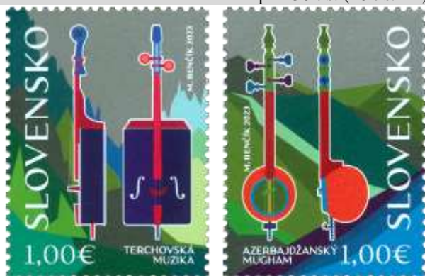
801) dvojstrunová basa 802) kamanča

2. 10. 2023 * Spoločné vydanie s Azerbajdžanom: Terčovská muzika, azerbajdžanský mugham * príležitostné známky, spoločné vydanie s Azerbajdžanom * N: M. Benčík * OF + serigrafia Tiskárna Hradištko * PL: 30 ZP so striedaním stĺpcov známok 801 a 802, TF: 2 PL * papier FL * HZ 12 * FDC N: M. Benčík, digitálna tlač Tiskárna Hradištko * náklad: po 150 tis. (10 tis. PL)