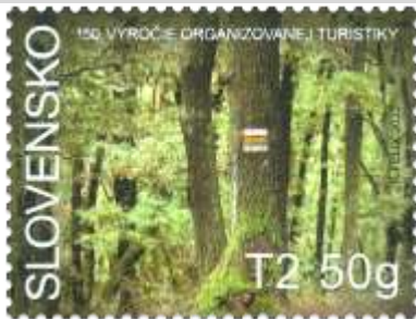
797) strom s namaľovanou turistickou značkou

14. 7. 2023 * Šport: 150. výročie organizovanej turistiky na území Slovenska * príležitostná známka * N: K. Felix * OF + serigrafia Tiskárna Hradištko * PL: 50 ZP, TF: 2 PL * papier FL * HZ 12 * FDC N: K. Felix, digitálna tlač Tiskárna Hradištko * náklad: 1 mil.