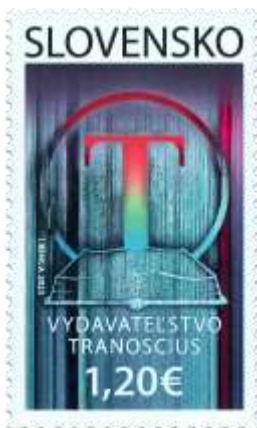
792) logotyp vydavateľstva Transoscius