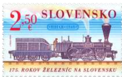
798) parný rušeň Bihar