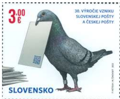
803) symbolická kresba poštového holuba

2. 10. 2023 * 30. výročie Českej pošty a Slovenskej pošty * príležitostná známka v hárčekovej úprave, spoločné vydanie s ČR * N: F. Heyduk, R: M. Činovský * OTp+OF Tiskárna Hradištko * H: 1 ZP + 2 K, TF: ? H * papier FL * RZ 11¼ * FDC N: F. Heyduk, R: M. Činovský, OTp Tiskárna Hradištko * náklad: 60 tis.