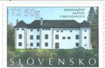
800) kaštieľ v Brodzanoch (17. stor.)

22. 9. 2023 * Krásky našej vlasti: Kaštieľ v Brodzanoch * príležitostná známka * N: M. Činovský, R: F. Horniak * OTp+OF Tiskárna Hradištko * PL: 6 ZP, TF: ? PL * papier FL * RZ 11½ : 11¼ * FDC N+R: F. Horniak, OTp Tiskárna Hradištko * náklad: 60 tis. (10 tis. PL)