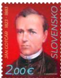
786) Ján Gotčár (1823 – 1883), slovenský národný buditeľ