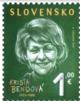
785) Krista Bendová (1923 – 1988), slovenská spisovateľka

27. 1. 2023 * Osobnosti: Krista Bendová (1923 – 1988) * príležitostná známka * N: N. Ložeková * OF Tiskárna Hradištko * PL: 50 ZP, TF: 2 PL * papier FL * HZ 11¼ : 11¼ * FDC N: N. Ložeková, R: Ľ.Žálec, OTp Tiskárna Hradištko * náklad: 500 tis.