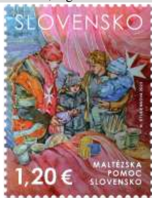
795) Maltézska pomoc utečencom z Ukrajiny

23. 6. 2023 * Spoločné vydanie so Zvrchovaným rádom Maltézskych rytierov * príležitostná známka * N: N. Studenková * OF + serigrafia Tiskárna Hradištko * PL: 10 ZP, TF: 4 PL * papier FL * HZ 12 * FDC N: N. Studenková, digitálna tlač Tiskárna Hradištko * náklad: 100 tis. (10 tis. PL)