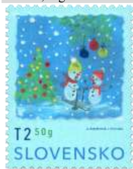
807) detská kresba „Dvaja snehuliaci“

16. 11. 2023 * Vianočná pošta 2023 * príležitostná známka * N: A. Horváthová, GÚ: J. Tóth * OF Tiskárna Hradištko * PL: 50 ZP, TF: 2 PL * papier FL * HZ 11¼ : 11¼ * FDC N: L. Sedliáčková, NP: R. Uňatinská, GÚ: J. Tóth, digitálna tlač Tiskárna Hradištko * náklad: 500 tis.