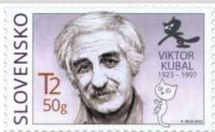
791) Viktor Kubal (1923 – 1997), slovenský výtvarník a karikaturista,

20. 3. 2023 * Osobnosti: Viktor Kubal (1923 – 1997) * príležitostná známka * N: K. Felix * OF Tiskárna Hradištko * PL: 50 ZP, TF: 2 PL * papier FL * KHZ 11¼ : 11¼ * FDC N: K. Felix, digitálna tlač Tiskárna Hradištko * náklad: 1 mil.